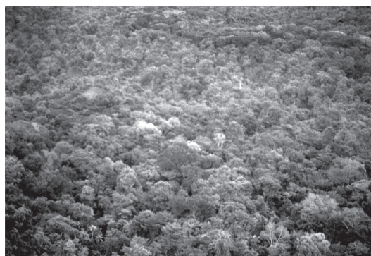
Figura 5 – Floresta aluvial em área de várzea na Reserva Biológica de Poço das Antas, Silva Jardim, Rio de Janeiro.

Os ambientes de floresta aluvial apresentam tipos de solo e condições de inundação bastantes variáveis. Em geral são ambientes muito heterogêneos, formando mosaicos de locais com diferentes níveis de inundação, onde conforme a quantidade e o tempo de permanência da água, a fisionomia pode variar quanto ao porte, ao adensamento dos indivíduos e às espécies características.