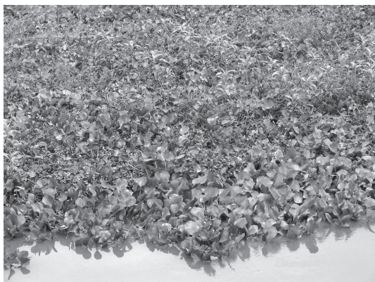
Figura 13 - Formação pioneira com influência fluvial com plantas aquáticas natantes na Rebio de Poço das Antas, Silva Jardim, Rio de Janeiro.