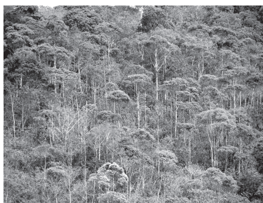
Figura 8 - Floresta submontana degradada na Rebio de Poço das Antas, Silva Jardim, Rio de Janeiro.

Nos locais em bom estado de preservação apresenta fisionomia arbórea dominante, formando um dossel fechado e pouco uniforme e ocorrência de árvores emergentes (Fig. 7). As árvores do dossel atingem alturas entre 17 e 23 metros, enquanto as emergentes alcançam até cerca de 30 metros. Entre as espécies que mais se destacam pelo porte muito elevado estão: jequitibá ( Cariniana legalis e Cariniana estrellensis ), garápa ( Apuleia leiocarpa ), figueira (espécies de Ficus ), caingá ( Moldenhawera polysperma ) e vinhático ( Platymenia foliolosa ). Destacam-se ainda pelo grande número de indivíduos Senefeldera verticillata , Siparuna reginae , Mabea piriri , Casearia sylvestris , Clethra scabra e Pseudopiptadenia contorta . Em alguns trechos, principalmente em grotas úmidas, são ocasionais os adensamentos de