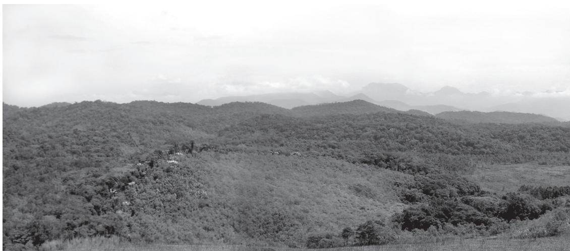
Figura 2 - Vista geral de trecho com morros e morrotes de perfis arredondados na Reserva Biológica de Poço das Antas, Silva Jardim, Rio de Janeiro.

As classes de solos (EMBRAPA 1999) estão distribuídas basicamente entre os solos de elevações, que são os Argissolos e os Cambissolos; e os solos de várzea, que são os Gleissolos, os Neossolos Flúvicos e os Organossolos. Ocorre um predomínio de solos álicos e, à exceção dos Neossolos Flúvicos e