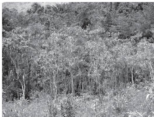
Figura 9 – Capoeira aluvial com adensamento de ipê-tamanco ( Tabebuia cassinoides ) na Rebio de Poço das Antas, Silva Jardim, Rio de Janeiro.

Os elementos arbóreos variam entre 3 e 5 metros de altura, observando-se variados padrões fisionômicos de acordo com as espécies dominantes (Figs. 9 e 10). Adensamentos de indivíduos jovens de ipê-tamanco ( Tabebuia cassinoides ), ou guanandí ( Symphonia globulifera ), ou tucum ( Bactris setosa ), ou embaubinha ( Cecropia lyratiloba ) são os padrões mais