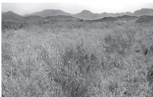
Figura 15 - Campo antrópico com domínio de sapé ( Imperata brasiliensis ), capim-colonião ( Panicum maximum ) e alecrim ( Bacharis dracunculifolia ) na Rebio de Poço das Antas, Silva Jardim, Rio de Janeiro.

forma agrupamentos densos onde o solo apresenta maiores teores de umidade podendo permanecer, muitas vezes, alagado em determinados períodos do ano. Andropogon bicornis , Imperata brasiliensis , Hyparrhenia rufa e Panicum maximum predominam em áreas mais secas enquanto outras espécies, a exemplo de Polygonum acuminatum e Aeschynomene sensitiva , são típicas de áreas mais úmidas, porém não encharcadas. As autoras destacam também, o predomínio de espécies de gramíneas, Imperata brasiliensis , Hyparrhenia rufa , Panicum maximum e de ervas perenes, a exemplo de Sabicea aspera var. glabrescente , Clidemia biserrata e Scleria sp. e de algumas samambaias como Lygodium volubile e Blechnum serrulatum . Estes grupos (gramíneas, ervas perenes e samambaias) apresentam características que atuam fortemente no processo sucessional da comunidade, e