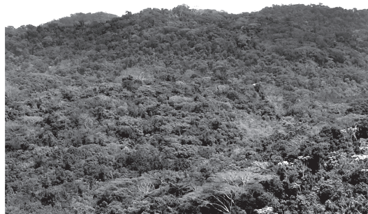
Figura 7 – Floresta submontana bem preservada na Rebio de Poço das Antas, Silva Jardim, Rio de Janeiro.

Associados a esta fisionomia foram observados principalmente Argissolos (associação que cobre aproximadamente 30% da área total da Reserva de Poço das Antas), álicos a moderados, com textura variando de argilosa a muito argilosa. Cambissolo ocorre apenas no Morro da Portuense, o ponto mais alto da Rebio (Takizawa 1995), e há ainda uma associação dessa fisionomia (somente 2% da área total da Reserva) com gleissolos, na unidade geomorfológica denominada de alvéolo (Takizawa 1995), localizada entre as encostas dos morrotes e as várzeas internas. A ocorrência desses gleissolos explica-se pela drenagem imperfeita da água nesse compartimento, que por sua vez recebe toda argila carregada dos pontos mais altos da paisagem: gleissolos são solos acinzentados pelas condições de hidromorfismo e com alto teor de argila nas camadas superficiais (Embrapa 1999).