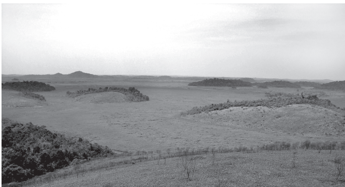
Figura 3 - Vista geral de um trecho de planície com morrotes isolados na Reserva Biológica de Poço das Antas, Silva Jardim, Rio de Janeiro.