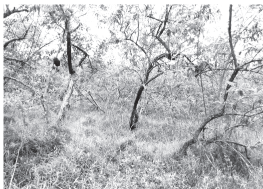
Figura 12 - Capoeira submontana com adensamento de cambará ( Gochnatia polimorpha ) na Rebio de Poço das Antas, Silva Jardim, Rio de Janeiro.

Em comunidades de plantas aquáticas graminóides, geralmente fixadas no substrato, predominam a tabôa ( Typha dominguensis ) e várias espécies de Cyperaceae, entre as quais predominam Cladium jamaicense e Cyperus ligularis (Fig. 14). Associadas a este complexo de vegetação de áreas alagadiças, ocorrem trechos de turfeiras formadas principalmente por Sphagnum sp. Comunidades de plantas arbustivas lenhosas ocorrem, geralmente, na periferia de locais inundados, onde domina o tucum ( Bactris setosa ).