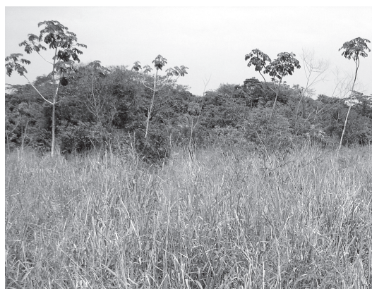
Figura 10 – Capoeira aluvial com embaubinha ( Cecropia lyratiloba ) na Rebio de Poço das Antas, Silva Jardim, Rio de Janeiro.

comuns. Além dessas espécies arbóreas, com certa frequência são observados exemplares de Inga laurina , Andira anthelmia e Rauwolfia grandiflora . Em planícies aluviais com grande extensão de áreas degradadas, que foram submetidas a drásticas mudanças no regime hídrico, estes adensamentos homogêneos de espécies acima citadas distribuem-se em mosaicos. Nos locais mais impactados podem ser percebidas manchas diferenciadas, onde predominam Schinus terebinthifolius , Trema micrantha e Cecropia glazioui .