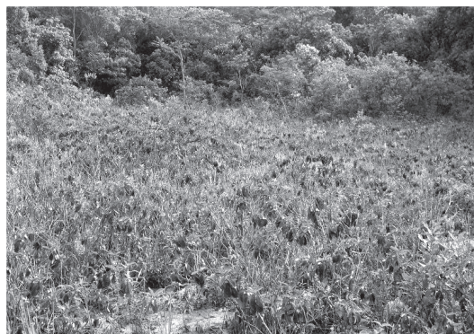
Figura 11 – Capoeira submontana com adensamento de pixirica ( Miconia albicans ) na Rebio de Poço das Antas, Silva Jardim, Rio de Janeiro.

É um complexo vegetacional com grande variação na fisionomia conforme a altura da lâmina da água e tempo de permanência desta. As comunidades de plantas aquáticas natantes ou submersas são constituídas principalmente por aguapé ( Eichhornia crassipes ), cabomba ( Cabomba aquatica ) e lentilha-d'água ( Salvinia auriculata ). Estas plantas ocorrem nas várzeas permanentemente alagadas e em alguns trechos, em geral meandros muito pronunciados, do rio São João (Fig. 13). Algumas áreas alagadas, em geral no entorno da barragem, foram invadidas por gramíneas aquáticas, principalmente algumas espécies do gênero Brachiaria .