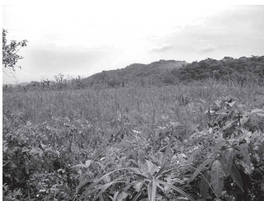
Figura 14 - Formação pioneira com influência fluvial com plantas aquáticas gramínoideas na Rebio de Poço das Antas, Silva Jardim, Rio de Janeiro.

desta região foram alterados por impactos antrópicos, particularmente onde dominam várias espécies de gramíneas, principalmente Panicum maximum e Imperata brasiliensis , bem como densos agrupamentos da samambaia Pteridium aquilinum . As espécies arbóreas Cecropia glazioui e Trema micrantha podem ocorrer dispersas ou formando pequenos aglomerados, normalmente caracterizados unicamente pela presença de apenas uma destas ou de ambas as espécies (Silva-Matos et al. no prelo).