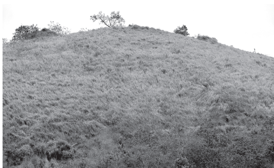
Figura 16 - Campo antrópico com domínio de capim-gordura ( Melinis minutiflora ) na Rebio de Poço das Antas, Silva Jardim, Rio de Janeiro.

representam obstáculos à ocorrência de mudanças que propiciem a formação de uma cobertura florestada na paisagem.