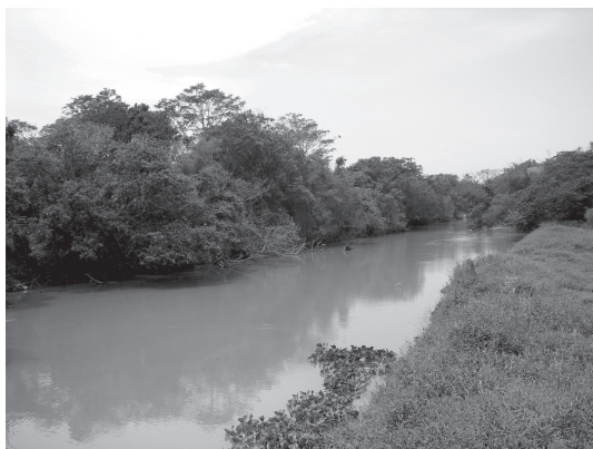
Figura 6 - Floresta aluvial em faixa meândrica do rio São João na Reserva Biológica de Poço das Antas, Silva Jardim, Rio de Janeiro.

Associados a esta fisionomia foram observados Gleissolos, Neossolos Flúvicos, Planossolos e, em menor escala, Organossolos (classes modificadas a partir de Takizawa 1995). Esses quatro tipos de solo são associados a situações na paisagem onde a drenagem ao longo do perfil é imperfeita. Na maior parte desses solos há um maior acúmulo de matéria orgânica nas camadas superficiais, que se decompõe mais lentamente em condições de hidromorfismo.