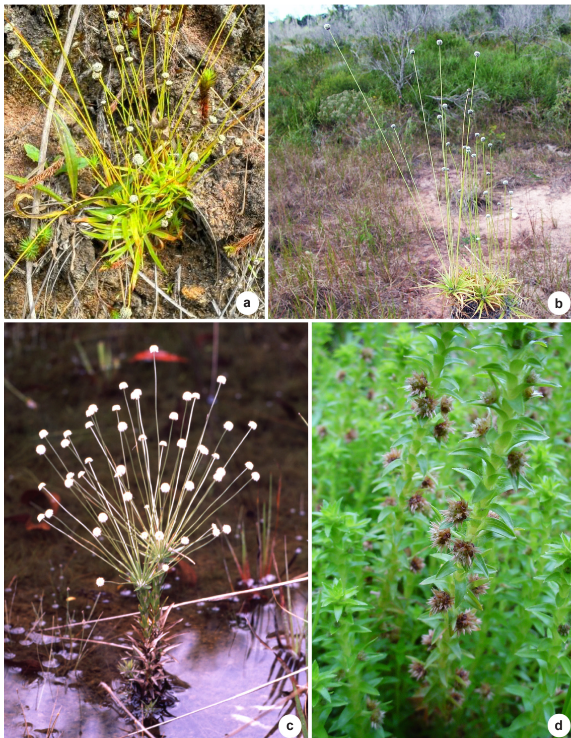
Figura 2 – Hábito e detalhes das espécies de Eriocaulaceae ocorrentes na região serrana do estado do Rio de Janeiro – a. Paepalanthus ovatus ; b. Paepalanthus tortilis ; c. Syngonanthus caulescens ; d. Tonina fluviatilis.

Figure 2 – Habit and details of the Eriocaulaceae species from the região serrana of the Rio de Janeiro state – a. Paepalanthus ovatus ; b. Paepalanthus tortilis ; c. Syngonanthus caulescens ; d. Tonina fluviatilis.