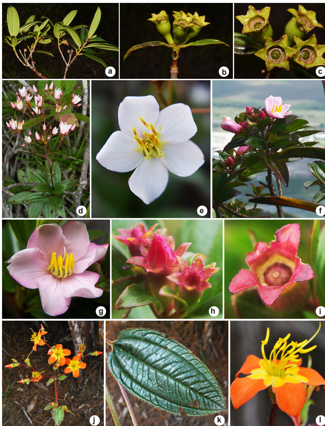
Figura 2 – a-l. Behuria e Cambessedesia no Espírito Santo – a-c. Behuria capixaba – a. ramo fértil; b. frutos imaturos, vista lateral; c. frutos imaturos, vista apical. d,e. Behuria comosa – d. ramo fértil; e. flor. f-i. Behuria mestrealvarensis – f. ramo fértil; g. flor; h. botão floral; i. fruto imaturo. j-l. Cambessedesia eichleri – j. ramo fértil; k. folha, superfície adaxial; l. flor.

Figure 2 – a-l. Behuria and Cambessedesia in Espírito Santo – a-c. Behuria capixaba – a. fertile branch; b. young fruits, lateral view; c. young fruits, apical view. d,e. Behuria comosa – d. fertile branch; e. flower. f-i. Behuria mestrealvarensis – f. fertile branch; g. flower; h. flower bud; i. young fruit. j-l. Cambessedesia eichleri – j. fertile branch; k. leaf, adaxial surface; l. flower.