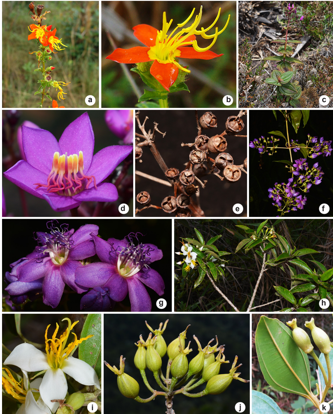
Figura 3 – a-k. Cambessedesia e Huberia no Espírito Santo – a,b. Cambessedesia hilariana – a. ramo fértil; b. flor; c-e. Dolichoura kollmannii – c. ramo fértil; d. flor; e. frutos maduros; f,g. Dolichoura spiritusanctensis – f. ramo fértil; g. flores; h-j. Huberia espiritosantensis – h. ramo fértil; i. flor; j. frutos imaturos; k. Huberia ovalifolia – frutos imaturos.

Figure 3 – a-k. Cambessedesia and Huberia in Espírito Santo – a,b. Cambessedesia hilariana – a. fertile branch; b. flower; c-e. Dolichoura kollmannii – c. fertile branch; d. flower; e. mature fruits; f,g. Dolichoura spiritusanctensis – f. fertile branch; g. flowers; h-j. Huberia espiritosantensis – h. fertile branch; i. flower; j. young fruits; k. Huberia ovalifolia – young fruits.