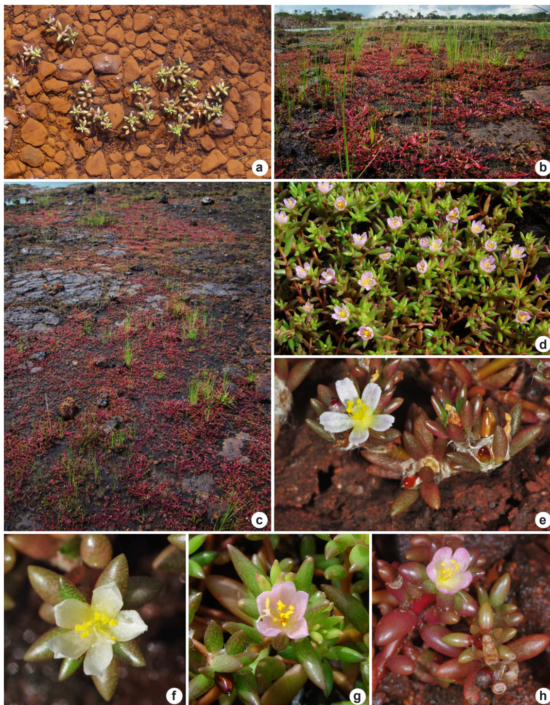
Figura 2 – a-h. Portulaca sedifolia – a. habitat em período chuvoso; b-c. habitat em período seco, folhas e ramos com coloração avermelhada; d-h. ramos floridos. Figure 2 – a-h. Portulaca sedifolia – a. habitat during the rainy season; b-c. habitat during the dry seasons showing reddish leaves and stems; d-h. flowering branches.