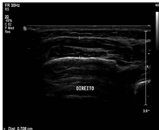
Figura 1. Imagem ultrassonográfica do repouso

Para a análise dos resultados da EMGs foi utilizada a análise do domínio temporal. Neste caso, a informação obtida descreve em que momento o evento ocorreu e qual a amplitude (indicador da magnitude da atividade muscular) de sua ocorrência. Na situação de repouso, os valores obtidos representaram a