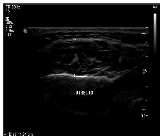
Figura 2. Imagem ultrassonográfica do MIC

média (RMS) da atividade eletromiográfica observada em 30 segundos. A duração da atividade muscular durante as tarefas de apertamento dentário (AI e MIC) foi obtida pela seleção do trecho representativo da ativação muscular (situação on , pico e off ). Esse trecho foi selecionado com o cursor do próprio programa de eletromiografia e convertido em \mu\text{V} (Figura 3).