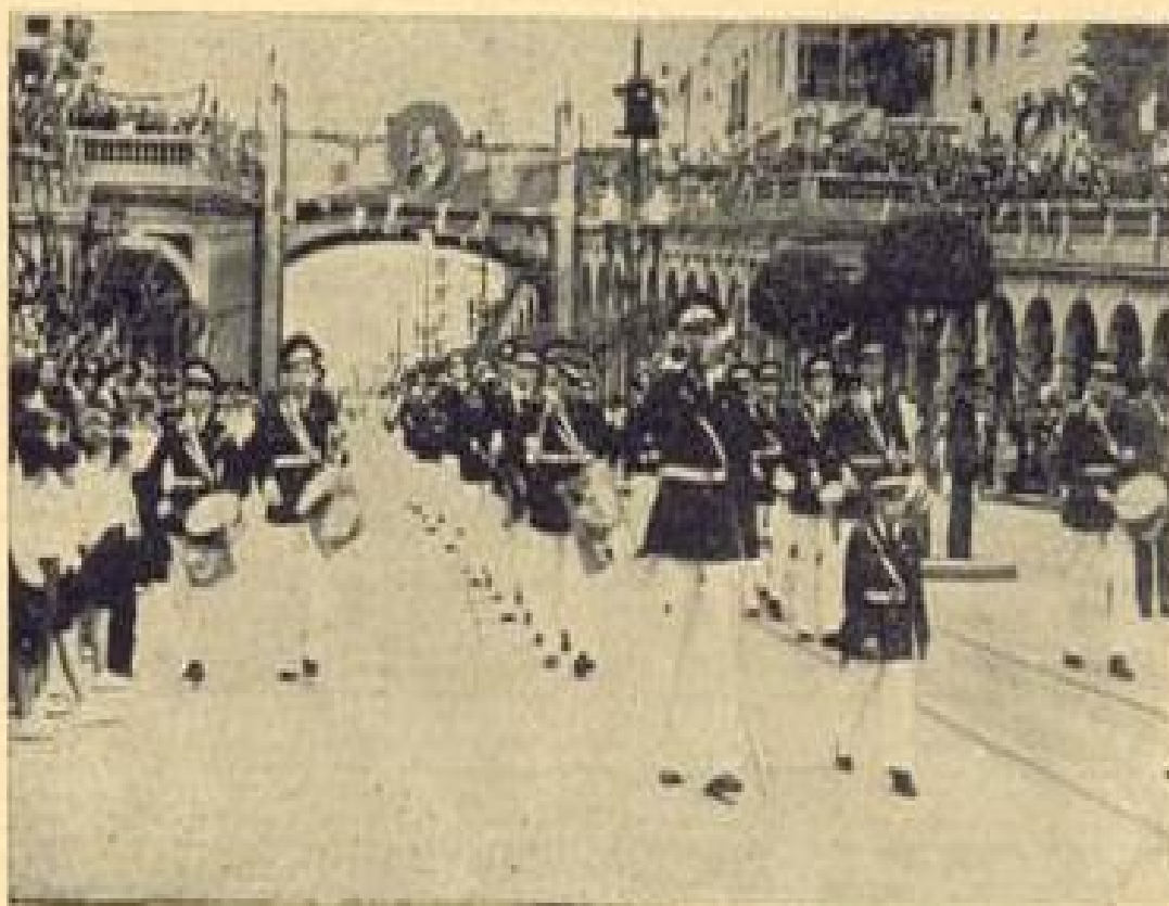
Desfile de alunos por ocasião da Parada da Juventude

Desfile de alunos por ocasião da Parada da Juventude (legenda original).