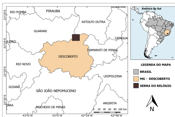
Figura 1. Localização da Serra do Relógio, Descoberto, MG, Brasil.

Figure 1. Location of Serra do Relógio, Descoberto, MG, Brazil.