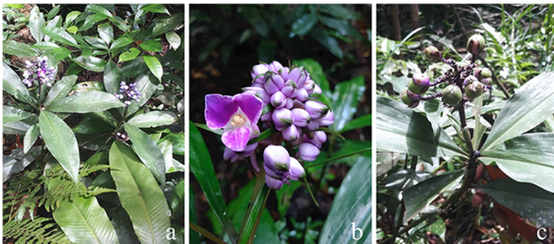
Figura 2. Dichorisandra procera Mart. ex Schult. a. hábito. b. detalhe da flor. c. detalhe dos frutos ( J.O. Costa et al. 4).

Ervas eretas, robustas, 0,5-1,3 m alt. Caules não ramificados, glabros, crassos; raízes tuberosas presentes. Folhas alterno-espirladas; bainha 1,5-3 cm compr., glabras, margens ciliadas, acastanhadas; pecíolos 1-3 cm compr., glabros ou raro tricomas dispersos; lâminas 10-30 × 6-10 cm, lanceoladas a oblongas, base atenuada, ápice acuminado, margem glabra. Inflorescências terminais, eretas, folhas basais não diferenciadas ou pouco menor que as demais, 3-6 × 0,5-1 cm; pedúnculo 2-4 cm compr.; cincinos 10-22, pedúnculos 2-3,2 cm compr., pilosos, cincinos congestos no ápice, ca. 3-4 flores; brácteas 1-3 × 0,2-0,5 cm, estreitamente lanceoladas a lineares triangulares, ambas as faces glabras, margem glabra a esparsamente ciliada, arroxeadas; bractéolas 3-5 × 2-3 mm, face adaxial pilosa, face abaxial glabra, margem glabra a esparsamente ciliada, arroxeadas. Flores pediceladas, pedicelos 0,1-0,5 cm compr.; sépalas 1-0,7 × 0,5-0,7 cm, elípticas a ovadas, glabras, arroxeadas; pétalas 0,8-1,4 × 0,6-1,2 cm, obovais, arroxeadas; estames 6, tamanhos