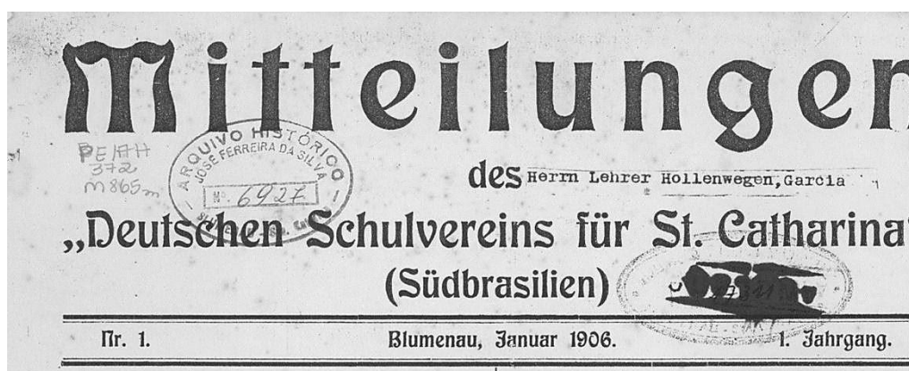
Figura 1. Cabeçalho do jornal Mitteilungen .

O cabeçalho é composto do nome do jornal enfatizando o termo Mitteilungen (Comunicações) em fonte maior e o restante des Deutschen Schulvereins für St. Catharina (da Sociedade Escolar Alemã de Santa Catarina) em fonte menor e entre aspas. Entre dois traços o número do exemplar, a data e o ano, conforme figura 1.