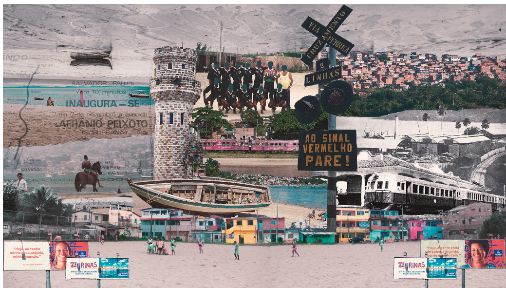
Figura 8. Fazer-cidade entre o ferro e o mar

altinha. Os pescadores e comerciantes ambulantes utilizam dos dias de “baba” 22 para vender aos torcedores, jogadores, banhistas e funcionários dos bares.