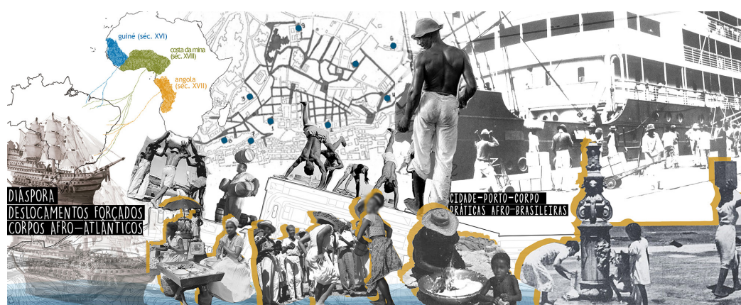
Figura 7. Corpo-porto-cidade

Alertamos que os fragmentos textuais aqui trazidos não se propõem a esgotar os sentidos das imagens mobilizadas e seus distintos processos de construção. Experimentamos estratégias de narração como possibilidade para estabelecer diálogos a partir de variadas composições e diferentes formatos, de modo a documentar, visibilizar, reconstruir e refletir sobre as formas de fazer-cidade que as margens evocam. Apesar de a produção acadêmica ainda privilegiar a escrita em detrimento de demais linguagens (HOOKS, 2017), utilizamos fotografias, colagens, cartografias, áudios, vídeos, entre outros, como processo reflexivo e, ao mesmo tempo, como ferramenta para socializar nossos resultados através de múltiplas expressões (Figura 7).