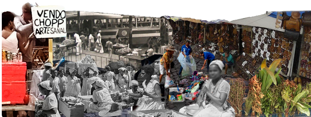
Figura 5. Modos de fazer urbanos e ancestrais

Temos buscado ultrapassar uma percepção homogeneizada, voltando-nos para as complexidades que formam os territórios populares e negros. A esse respeito, Simone (2004) contribuiu para pensarmos como a autorresponsabilidade pela sobrevivência urbana deu abertura para diferentes formas de organizar o espaço. O autor elabora a ideia de “pessoas como infraestruturas”, estendendo a noção de infraestrutura para além dos componentes físicos ao incorporar diretamente as atividades das pessoas que provêm meios para tornar a cidade produtiva, reproduzindo e posicionando seus residentes, territórios e recursos.