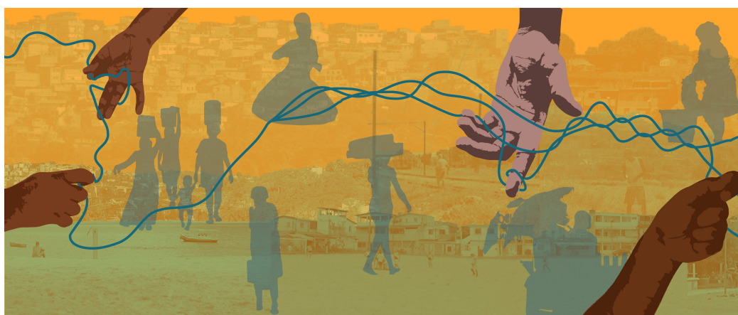
Figura 1. Cidades-margens

críticas, engajamentos e implicações políticas em relação às dimensões sociais e humanas constituintes da cidade. Ao lado dessas concepções, encontra-se, ainda, nossa composição diversa como grupo de autoras que se juntam neste texto: um homem negro e quatro mulheres negras e brancas, LGBTQIAP+, nordestinas, originárias e/ou engajadas politicamente com os territórios onde as pesquisas se constroem.