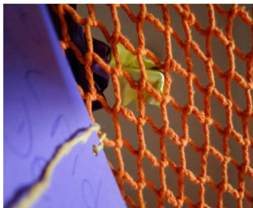
Figura 3. Instalação das Redes, com as tarjetas amassadas ou amarradas.

A produção de um blog permitiu diversos usos, em diferentes momentos dos encontros. No início se apresentou como forma profícua de apresentação dos participantes, como dinâmica das oficinas, meio de divulgação, registro e memória das atividades e produtos realizados, além disso, como valorização dos sujeitos, interação virtual e ainda transformação de conceitos,