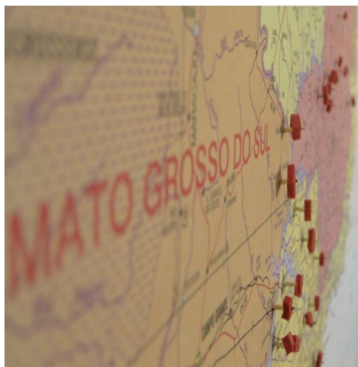
Figura 2. Mapa impresso com alfinetes demarcando uma trajetória.

A itinerância é considerada uma marca da população em situação de rua. Os encontros com nossos participantes revelavam uma vida de viagens, de idas e vindas, às vezes autônomas, outras impostas, mas certamente de saberes próprios. A fim de representar as trajetórias dos participantes, foram utilizados um mapa do Brasil, fios e alfinetes, e traçados os caminhos já percorridos por cada participante, produzindo a instalação artística “ Trajetórias ”. A dinâmica promoveu interação, identificação e socialização no grupo, além de muitas informações a respeito das histórias de vida de cada sujeito, pois além de identificar as cidades já percorridas, foi possível compreender os motivos, anseios, relações e dificuldades vivenciadas entre aqueles que fazem do ‘trecho’ sua própria jornada de vida e se encontra em trânsito há dias ou anos. Trajetórias são, portanto, todas essas histórias, caminhos, memórias de territorialidades, são as pegadas deixadas e os passos que ainda estão por vir, na perspectiva de que ouvir e refletir sobre essas experiências possam ressignificá-las.