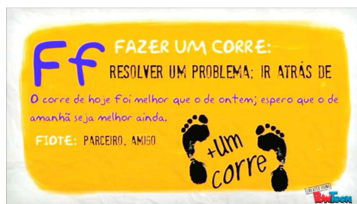
Figura 1. Verbetes do Dicionário da Rua Digital interativo.

Nesta perspectiva, foram realizados encontros nos quais os participantes relatavam e descreviam gírias utilizadas na comunicação das ruas, seus sentidos e significados, e ainda como as empregariam em expressões cotidianas. Esse mapeamento foi representado no “varal das palavras” que permaneceu exposto ao longo dos encontros, permitindo a constatação da riqueza desta linguagem própria, mobilizando a produção de um Dicionário da Rua digital interativo, que possui mais de cem verbetes, com seus significados e as aplicações em frases exemplificadas pelos próprios participantes.