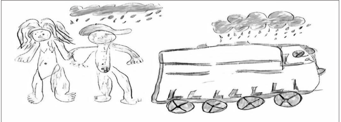
Figura 2. A caminhada sofrida

História: “[...] ele chamou a mãe, e a mãe o chamou para ir ao ponto de ônibus para ir ao hospital... falar com o médico o que era isso: o pênis estava duro e não queria amolecer a troco de nada. A mãe estava com um pouco de raiva, porque ela queria que ele pegasse o ônibus, mas ele não queria entrar no ônibus porque estava com vergonha e logo começou a chover. De tanto ela insistir, ele pegou o ônibus e foi até o hospital, debaixo de chuva” – Teseu.