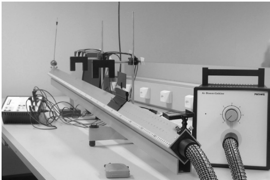
Figura 3: Trilho de ar inclinado.

formado pelos termos independentes do sistema.