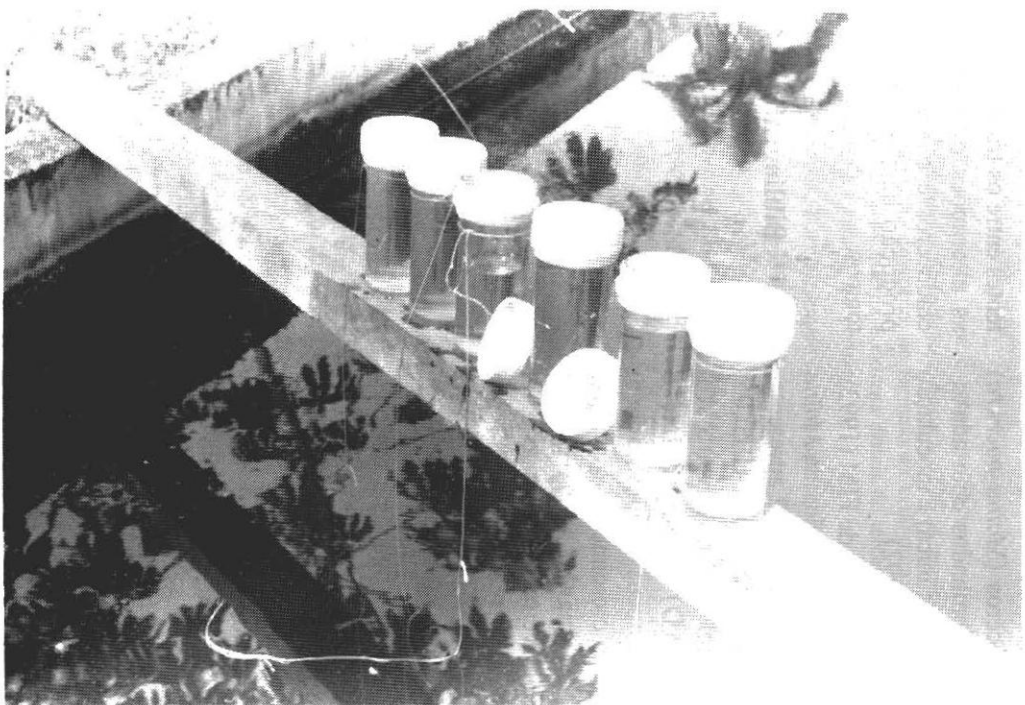
Figura 2. Ilustração mostrando as garrafas plásticas e seu posicionamento nos viveiros de peixes, durante a realização dos testes "in situ".