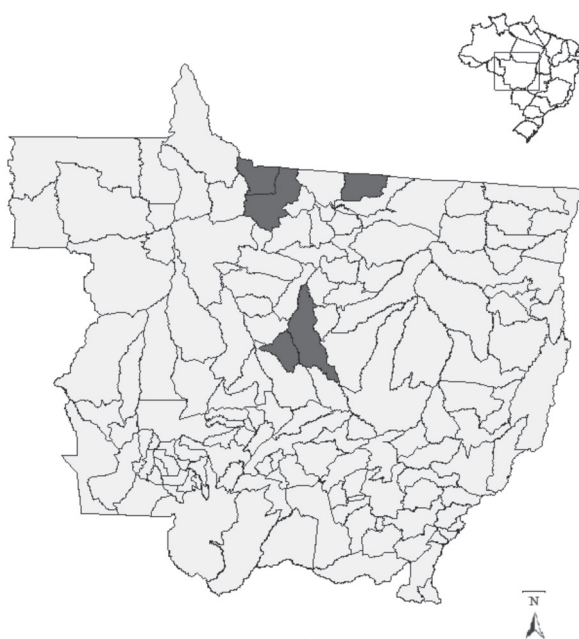
Figura 1 - Municípios de Alta Floresta, Guarantã do Norte e Paranaíta (Norte), Lucas do Rio Verde e Sorriso (Centro), nos quais foram encontrados espécimes de Panstrongylus lignarius no Estado de Mato Grosso, Brasil.

do Norte (lat. 09°47'15" Sul e long. 54°54'36" Oeste). Em novembro de 2009, o último espécime foi encontrado no município de Sorriso (lat. 11°43'38" Sul e long. 55°06'36" Oeste), próximo a região denominada de Área Verde localizada na área central da cidade, capturado por morador, no peridomicílio (Figura 1). Os municípios de Alta Floresta, Guarantã do Norte e Paranaíta, situam-se no Norte do Estado cuja vegetação é constituída por Floresta Ombrófila Aberta e Densa, Floresta Estacional e Savana, característica de Floresta Amazônica. Os municípios de Lucas do Rio Verde e de Sorriso estão localizados na micro-região geográfica Alto Teles Pires,