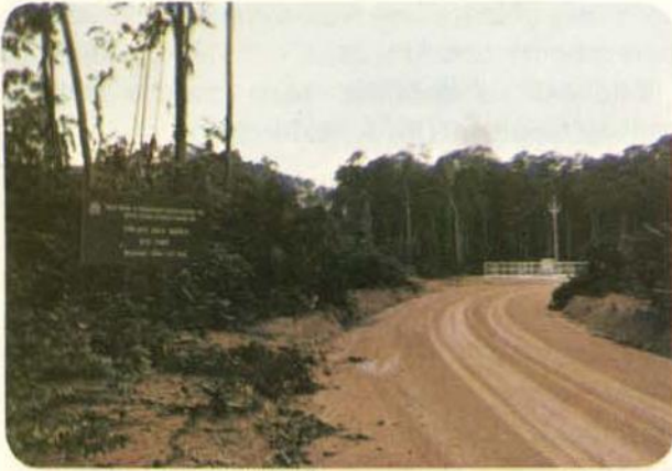
Fig. 3 — Área do Projeto "Bacia Modelo", localizada na ZF-02 Rodovia Manaus-Caracarái.

Outro projeto multidisciplinar é o Tamanho Mínimo Crítico de Ecossistemas, realizado em convênio entre o INPA/CNPq e NSF, que tem como objetivo estudar processos de extinção de populações, recolonização, e manutenção da diversidade biológica em florestas de terra firme, tendo portanto relevância para o manejo e conservação dos recursos biológicos da Amazônia.