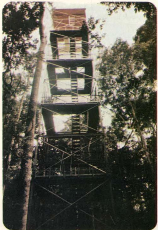
Fig. 4 — Torre metálica instalada na Bacia Hidrográfica Modelo.

Medidas de radiação solar global ao nível do solo ( Q_g ) com pireliômetro de precisão Eppley foram realizadas em Manaus no período 1977-1979. Os maiores valores médios mensais observaram-se nos meses de setembro