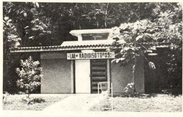
Fig. 6 — Laboratório de Radioisótopos — sede do INPA.

Em abril de 1980, foi inaugurado o Laboratório de Radioisótopos do Departamento de Ecologia (Fig. 6).