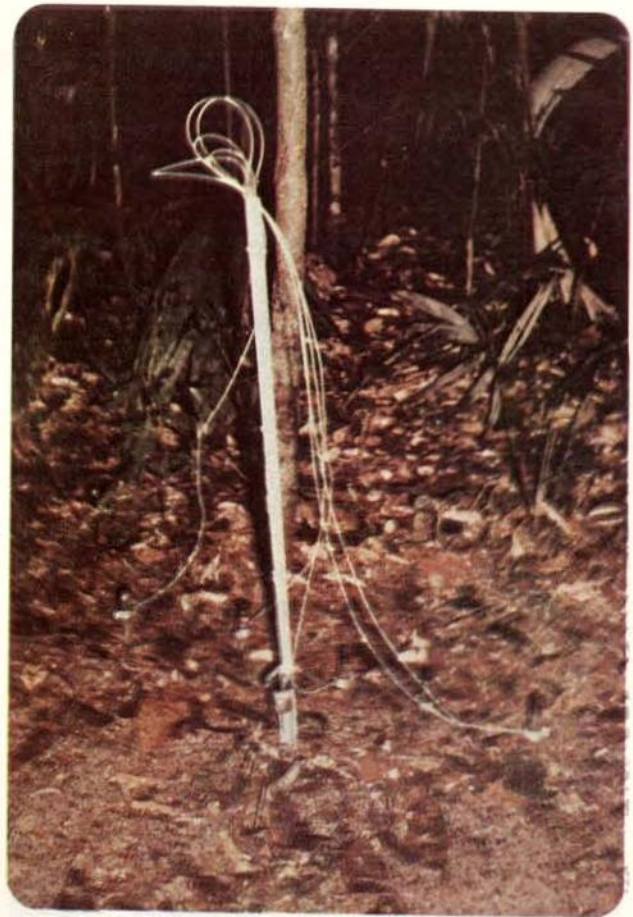
Fig. 5 — Tensiômetro, aparelho para medir a saturação água no solo.

De um modo genérico, a maior concentração de vapor d'água atmosférico ocorre entre Manaus e Iquitos. Estimou-se em 35 mm o valor médio da água precipitável sobre a bacia Amazônica, bem como, em 18,2% o valor da