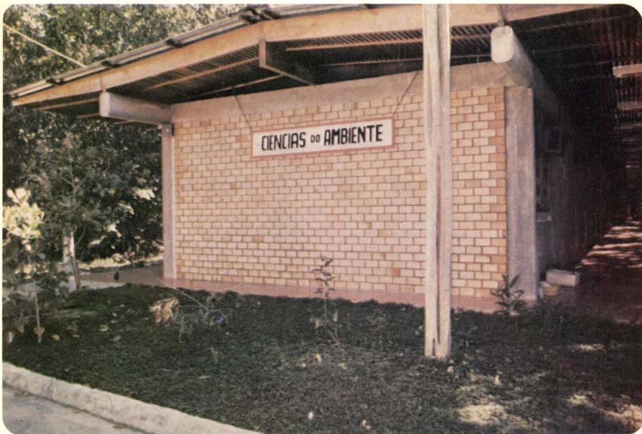
Fig. 1 — Pavilhão da Divisão de Ciências do Ambiente na sede do INPA, Estrada do Aleixo.

No exercício 1974-1978, na administração do Dr. Warwick Estevam Kerr, o Instituto Nacional de Pesquisas da Amazônia funcionou com seis Divisões de Pesquisas tendo entre elas a Divisão de Biologia, dentro da qual se situavam os Departamentos de Botânica, Ecologia, Entomologia e Genética.