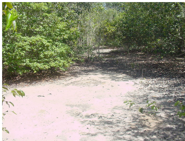
Figura 1 - Aspecto geral do ecossistema de campina da região da Confiança II, Município do Cantá, Roraima.