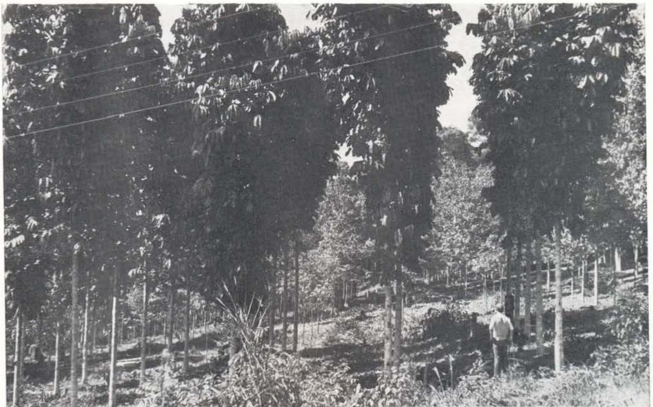
Foto 2 — Carapa guianensis Aubl (Andiroba), com 7 (sete) anos, parcela E 2 E 3 F 2 F 3 , plantio em plena abertura