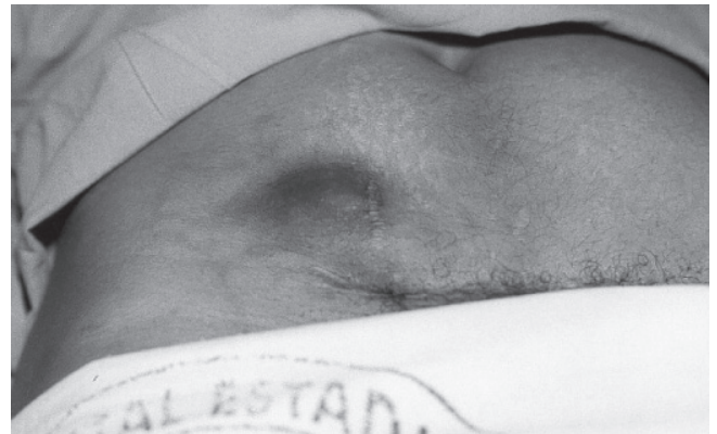
FIGURA 1 - Endometrioma próximo a cicatriz de cesariana, com destaque para coloração

A queixa principal em todos os casos foi de tumoração na parede abdominal que aumentava de volume e se tornava mais dolorosa na vigência do período menstrual. O tumor localizava-se nas fossas ilíacas em 11 pacientes (cinco à direita e seis à esquerda), e no flanco esquerdo em uma. Todos localizavam-se nas proximidades da cicatriz operatória de cesariana (Figura1). Em dois casos, situavam-se na região umbilical. Uma delas apresentava tumoração exóftica, com aspecto cerebriforme e sangramento externo durante o período menstrual. As dimensões das lesões situaram-se entre 1,6 x 1,5 cm e 6,0 x 4,0 cm. Todas tinham à palpação, limites imprecisos, consistência macia e sensibilidade aumentada.