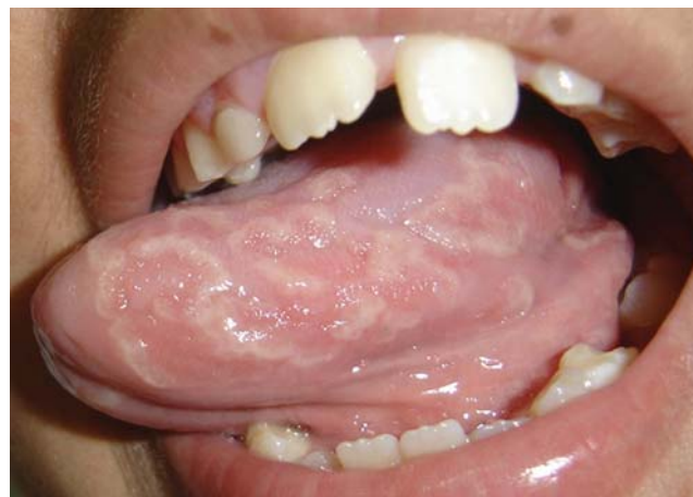
FIGURA 1: Língua geográfica

Realizou-se a cintigrafia óssea, revelando hiperfixação do radiofármaco, caracterizando o aumento de atividade osteogênica, na extremidade medial da clavícula direita, na extremidade proximal do úmero esquerdo, nas porções anteriores dos 5° e 6° arcos costais, à esquerda. Na radiografia, havia lesão lítica nos naviculares bilateralmente. As lesões periungueais alternavam entre exacerbação e remissão, com piora do edema e do eritema; iniciado o calcipotriol associado à betametasona tópicos, além de azitromicina oral. Ao exame dermatológico, notavam-se múltiplas pústulas diminutas acometendo região cervical, axilas e regiões inguinais, das quais foram solicitados exames