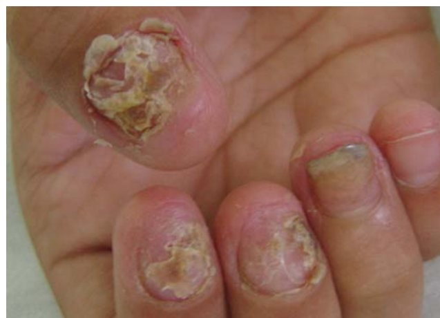
FIGURA 2: Lesão ungueal