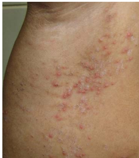
FIGURA 5: Pustulose amicrobiana das dobras

Com relação às lesões pustulosas nas regiões cervical, axilares e inguinais, a despeito dos exames micológico, bacteriológico e histopatológico houve dificuldade para classificá-las. Até que se passou a conhecer a entidade denominada pustulose amicrobiana das dobras na qual ele parece encaixar-se.