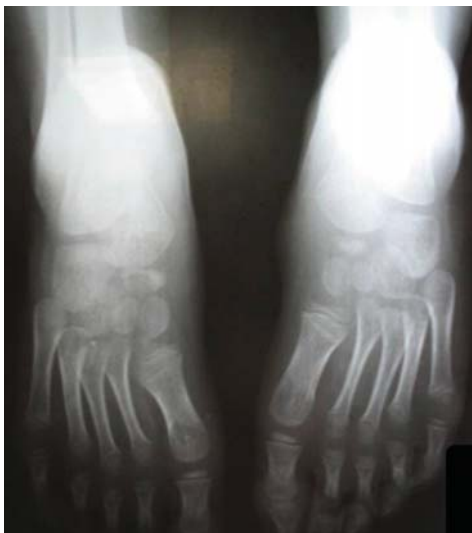
FIGURA 4: Lesão lítica

Iniciada a dapsona (0,5 mg/kg/dia), após a pesquisa de deficiência de glicose-6-fosfato desidrogenase negativa. Com intuito de obter desaparecimento completo das lesões, a dose foi aumentada para 1 mg/kg/dia, ocasionando intolerância gastrointestinal, obrigando a sua suspensão. A colchicina foi, então, prescrita, em dose crescente, com boa tolerância, embora sem resposta clínica satisfatória. Optou-se pela talidomida, na tentativa de controlar o quadro cutâneo, com resposta parcial, pois houve a dificuldade na obtenção do fármaco para continuar o tratamento. Seguiu-se o uso de eta-