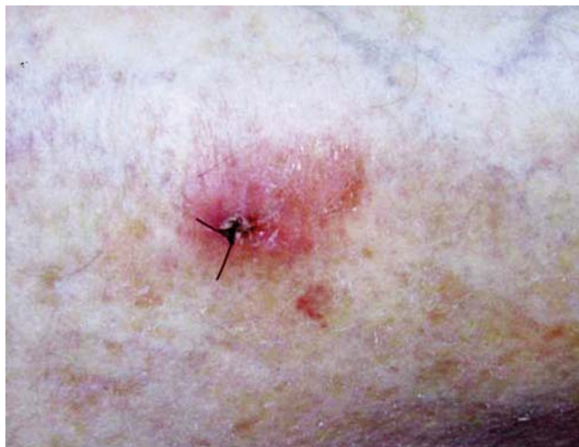
FIGURA 5: Lesão de CBC superficial na perna pré-tratamento (MAL-TFD)

Alguns artigos citam o uso isolado da luz azul, e outros comparam o maior benefício de ALA associado a essa luz. O tempo de incubação do ALA é variável nos estudos, entre 15 minutos e três horas. 29,30,31