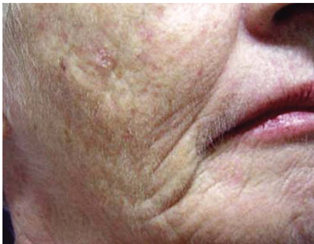
FIGURA 3: Campo de ceratose actínica na hemiface pré-tratamento (MAL-TFD)

Dragieva e colaboradores 24 avaliaram a eficácia da TFD com MAL em pacientes transplantados. A resolução completa ou a redução do número ou tamanho das 129 lesões ocorreram em até 16 semanas após o final do tratamento. O estudo conclui que o tratamento com MAL-TFD é seguro e eficaz no tratamento de QA em pacientes transplantados, podendo reduzir o risco de transformação para carcinoma escamoso invasivo.