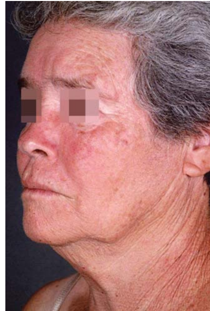
FIGURA 7: Hemiface fotodanificada pré-tratamento com MAL-TFD

A aplicação de ALA-TFD para fotoenvelhecimento é amplamente descrita na literatura. Zane e colaboradores, 42 entretanto, relataram eficácia e tolerabilidade do MAL no tratamento da pele fotodanificada. Avaliaram 20 pacientes com fotoenvelhecimento e QAs múltiplas. O MAL foi aplicado sob oclusão por três horas, antes da exposição à luz vermelha a 37 J/cm 2 . Duas sessões foram realizadas com um mês de intervalo. Houve melhora das QAs, com taxa de cura de 88,3%, associada à melhora global da pele (pigmentação, rugas finas e textura). Nossos resultados com MAL (três horas) e luz vermelha são semelhantes aos de Zane e colaboradores 42 (Figuras 7, 8). Em outro