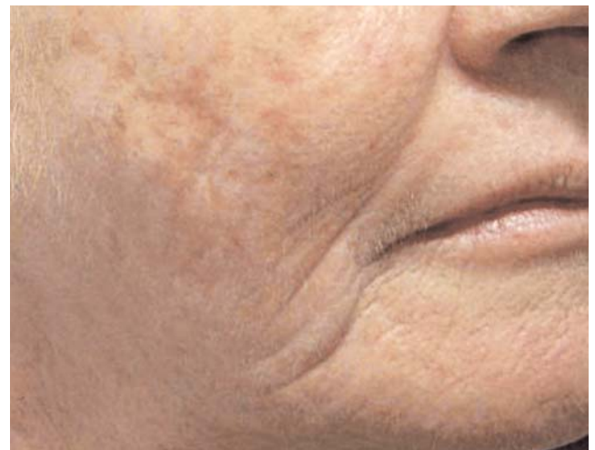
FIGURA 4: Campo de ceratose actínica na hemiface após três meses do tratamento (MAL-TFD)

A TFD com MAL e luz vermelha tem eficácia comprovada para essas indicações, alcançando taxa de cura próxima a 95% no CBC superficial, e de 73% a 94% no CBC nodular. A taxa de recidiva para CBC superficial é de aproximadamente 22%, semelhante à dos tratamentos convencionais, como a crioterapia, que apresenta taxa de recidiva em torno de 19%. Para CBC nodular, entretanto, a taxa de recidiva encontra-se próxima a 14%, comparada à recidiva de 4% da cirurgia, tratamento padrão para CBC nodular. Esses dados estatísticos do tratamento com MAL-TFD foram obtidos por estudos multicêntricos, com grande número de pacientes e com duração de cinco anos de acompanhamento. 3 Muitos autores enfatizam que as principais vantagens da TFD no tratamento de neoplasias malignas não melanoma são o significativo encurtamento do tempo de recuperação, o excelente resultado cosmético, a alta taxa de cura e a taxa de recorrên-