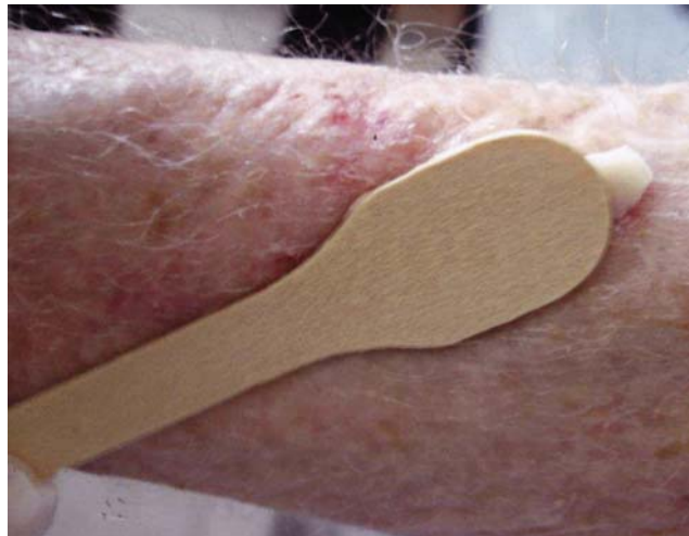
FIGURA 1: Aplicação do metilaminolevulinato com espátula de madeira sobre a lesão

O preparo da pele com a técnica adequada é fundamental para o sucesso do tratamento. Para a limpeza da pele é recomendado o uso de algodão com uma loção de limpeza sem sabão, seguido de uma passada de gaze com álcool. A etapa seguinte consiste no debridamento superficial da lesão, utilizando-se uma cureta. Após a interrupção do possível sangramento pela compressão com gaze seca, aplica-se o fotossensibilizante escolhido (Figura 1). Estão disponíveis no mercado brasileiro o ALA, com nome comercial de Levulan ® , em apresentação na forma de stick para preparo na hora do tratamento, e o MAL, com o nome comercial de Metvix ® , com apresentação em creme pronto para uso. O tempo de incubação do fotossensibilizante é determinado pelos protocolos pré-estabelecidos. Uma camada do creme de MAL com espessura de 1 mm sobre a lesão e com uma margem de 5 a 10 mm ao redor dela deve ser aplicada e mantida por três horas, sob curativo plástico oclusivo. Por cima do curativo plástico, deve-se aplicar uma proteção luminosa com papel laminado para que não haja