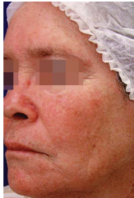
FIGURA 8: Melhora da pele fotodanificada após seis meses de tratamento com duas sessões de MAL-TFD, com efeito "lifting"

estudo, sobre remodelação dérmica da pele fotodanificada, utilizando, entretanto, o tempo de incubação do MAL de duas horas, também encontramos resposta clínica semelhante à do uso de três horas de incubação. 43