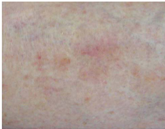
FIGURA 6: Acompanhamento da lesão de CBC superficial tratado com MAL-TFD após 12 meses

O uso de LIP também tem sido descrito como eficaz para tratamento de acne. O tempo de incubação do ALA pode ser menor, o que se denomina tratamento de contato curto, por um período de 30 minutos a uma hora. 35 A TFD com ALA-PDL ( laser de corante – pulsed dye laser ) pode ser considerada uma alternativa ao uso