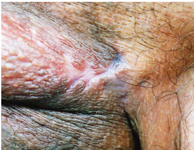
FIGURA 1: Cicatrizes atróficas localizadas na hemibolsa escrotal esquerda

Quanto à localização das lesões, geralmente é nos membros inferiores e superiores, sendo rara nas nádegas, pescoço, face e raríssima na bolsa escrotal. 4,6,11 Na revisão dos autores, foram encontrados dois