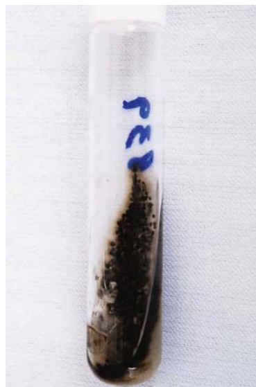
FIGURA 4: Cultura em meio Sabouraud 2%. Inicialmente demonstrou colônias de leveduras mucoides, globosas e de coloração preta

Quanto ao tratamento da feo-hifomicose subcutânea, alguns autores consideram o itraconazol como a droga de primeira escolha. 1,3,13 A terbinafina, isoladamente, também se mostrou útil no tratamento de infecção subcutânea refratária, o que pode sugerir a futura padronização do seu uso, combinada com outros agentes antifúngicos. 8,13