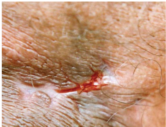
FIGURA 2: Detalhe da saída de exsudato serossanguinolento pelo trajeto fistuloso