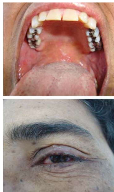
FIGURA 4: A - Lesões exulceradas em palato. 4B - Lesão vesicopustulosa, em pálpebra superior esquerda; sobre base eritematosa além de, comprometimento da mucosa conjuntival esquerda, por intenso enantema

de causa desconhecida e de difícil diagnóstico, caracterizada por lesões pustulosas, vesiculosas e placas vegetantes com comprometimento mucocutâneo. 2 Geralmente, comprometem os indivíduos, no final da terceira década de vida, sendo a proporção de incidência entre o sexo feminino e masculino de 3:1.1