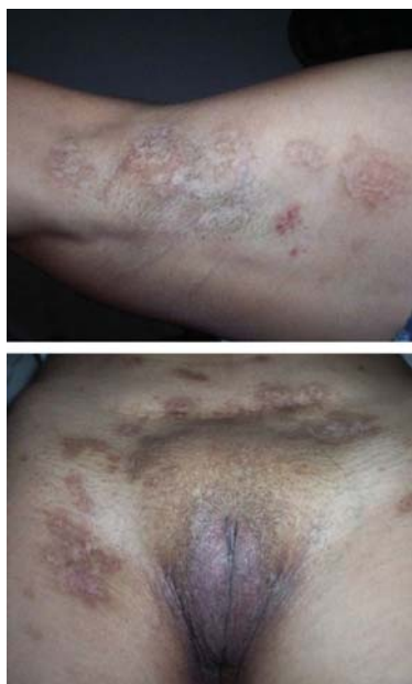
FIGURA 3: Máculas hipercrômicas residuais, em região axilar e vulvar, após introdução da corticoterapia