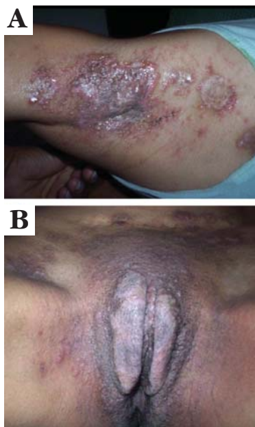
FIGURA 1: A - Pápulas eritematosas, pústulas, vesículas e lesões recobertas por crostas que coalescem formando placas vegetantes em região axilar. B - comprometimento da região vulvar, inguinal e hipogástrio

No período, houve a necessidade de hospitalização diante da exuberância do quadro clínico, iniciada antibioticoterapia sistêmica (cefalotina 2g a cada seis horas) por sete dias sem êxito. Durante a internação, foram realizados a biopsia de lesão vegetante axilar e o estudo histopatológico que evidenciaram: a ulceração e a hiperplasia epitelial adjacente, fenda subepidérmica focal, infiltrado inflamatório misto predominantemente eosinofílico, com distribuição perivascular, perianexial e intersticial associado a abs-