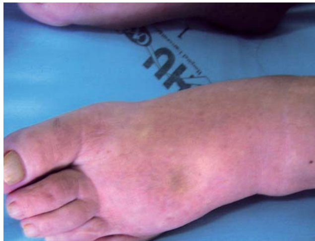
FIGURA 1: Linfedema

Dados relevantes do exame físico revelavam distrofia ungueal em ambas as mãos e pés, caracterizada por espessamento, opacidade, xantoniúquia, aumento das curvaturas lateral e ântero-posterior, onicólise e ausência de lúnula e cutícula (Figura 1). Apresentava, ao exame do aparelho respiratório, murmúrio vesicular abolido e frêmito toracovocal diminuído em bases. Nos membros inferiores, observava-se edema duro, com presença do sinal do cacifo (Figura 2). Exames complementares não evidenciaram alterações no hemograma, na bioquímica sanguínea, na função tireoideana, nem nos autoanticorpos e nas provas de atividade inflamatória; PPD reator fraco e anti-HIV negativo.