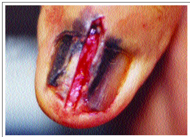
Figura 2: Biópsia incisional. Figure 2: Incisional biopsy.