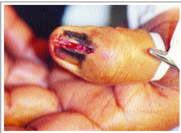
Figura 1: Lesão melanocítica envolvendo matriz, lâmina, leito e dobra ungueal proximal (Sinal de Hutchinson). Figure 1: Melanocytic lesion with involvement of the nail matrix, plate, bed and proximal nail fold (Hutchinson's sign).

NAM was first described by Boyer in 1834, 5 and in English by Hutchinson in 1886. 6