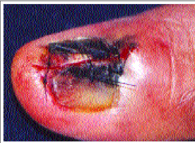
Figure 3: Lesion profile.

Estima-se que variações de 2 a 3 % dos melanomas em brancos e de 15 a 20 % em negros estejam localizadas no aparelho ungueal. Entretanto, não há diferença significativa do número de casos de melanoma ungueal entre indivíduos brancos e negros. 7 A incidência em crianças é rara, apesar do aumento do número de casos de melanoma. 8