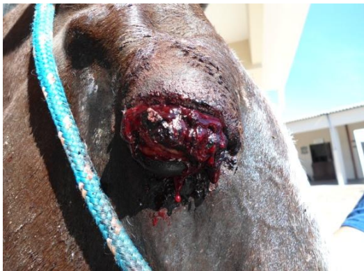
Figura 1. Secreção serossanguinolenta advinda da massa envolvendo a conjuntiva bulbar e a terceira pálpebra do globo ocular direito.

Foi atendida, no Hospital Veterinário da Universidade de Cuiabá (HV-UNIC), uma égua de raça indefinida, com 10 anos de idade e histórico de crescimento repentino de massa no globo ocular direito, com evolução de 14 dias. Ao exame físico, evidenciou-se secreção serossanguinolenta advinda de massa envolvendo a conjuntiva bulbar e a terceira pálpebra, que encobria praticamente todo o olho do animal, associada ao inchaço acentuado da pálpebra e quemose da conjuntiva palpebral (Fig. 1).