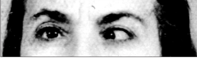
Fig. 3 - Foto antiga da paciente. ETOE bem menor (e pequena hipotropia OE).