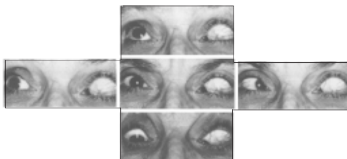
Fig. 1 - Pré-operatório, posições primária e cardeais. Note-se a imobilidade quase absoluta do OE.

O músculo reto medial mostrou-se muitíssimo curto (contraturado). Seu antagonista principal (músculo reto lateral) foi achado muito alongado e frouxo, dispondo-se obliquamente em direção ao limbo, no quadrante temporal inferior do