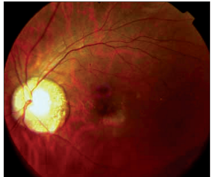
Figura 2 - Hipopigmentação da área macular

Na síndrome de Spielmeyer-Vogt têm-se alterações retinianas compatíveis com retinose pigmentar, quadro de ataxia, convulsões e demência progressiva.