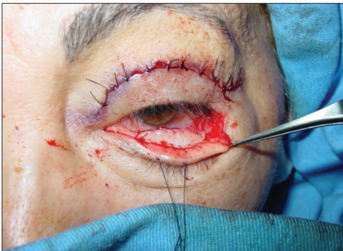
Figura 3 - Autoenxerto do tarso entre a margem inferior do tarso na pálpebra inferior e retratores

Não houve variação da rima palpebral no pré e pós-operatório. A média pré e pós-operatória da rima palpebral dos 9 olhos operados foi de 4,1 mm (variando de 3 a 5 mm). Uma paciente submetida à cirurgia unilateral apresentava rima palpebral zero no olho não operado. A função do músculo levantador da pálpebra superior foi ausente nos 2 olhos em todos os pacientes.