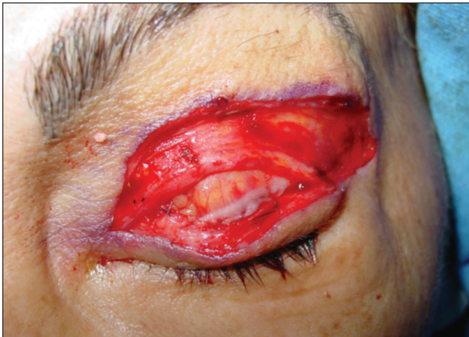
Figura 2 - Sutura do tendão do músculo levantador da pálpebra superior no tarso remanescente da pálpebra superior

Seis pacientes portadores de miopatia mitocondrial foram submetidos à cirurgia de tarsectomia da PS e autoenxerto na PI, sendo 5 pacientes do sexo feminino. A idade dos pacientes variou de 43 a 66 anos (média de 59,8 anos). Três pacientes foram submetidos a cirurgia em ambos os olhos e três pacientes em apenas um olho, totalizando 9 cirurgias neste estudo.