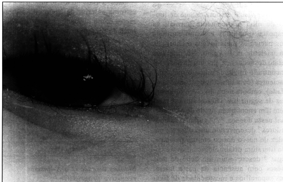
Fig. 2 - Cílios aberrantes e sobrancelhas ressecadas, enroscadas e despigmentadas (canto direito sup. da fotografia)

com nenhum dos olhos, nem seguia luz. Seus cabelos eram ressecados, enroscados e de cor esbranquiçada. As respostas pupilares estavam normais, mas os olhos apresentavam movimentos nistagmóides. Ao exame biomicroscópico notou-se a presença de pannus corneano superior e hipoplasia do estroma anterior da íris em ambos os olhos (Figura 1). Ele apresentava leve hipermetropia e astigmatismo no exame de refração sob cicloplegia. O fundo de olho estava normal em ambos os olhos. O ERG foi realizado sem a utilização de anestesia, usando o aparelho "Nicolet Path Finder". O ERG fotópico foi normal; ambas as ondas a e b apresentaram-se com tempo de resposta e amplitude normais. Quando realizado sob a condição de "adaptado ao escuro", o ERG apresentou-se anormal; ambas as ondas a e b foram registradas, porém com reduzida amplitude. As respostas escotópicas apresentaram-se marcadamente reduzidas e retardadas bilateralmente.