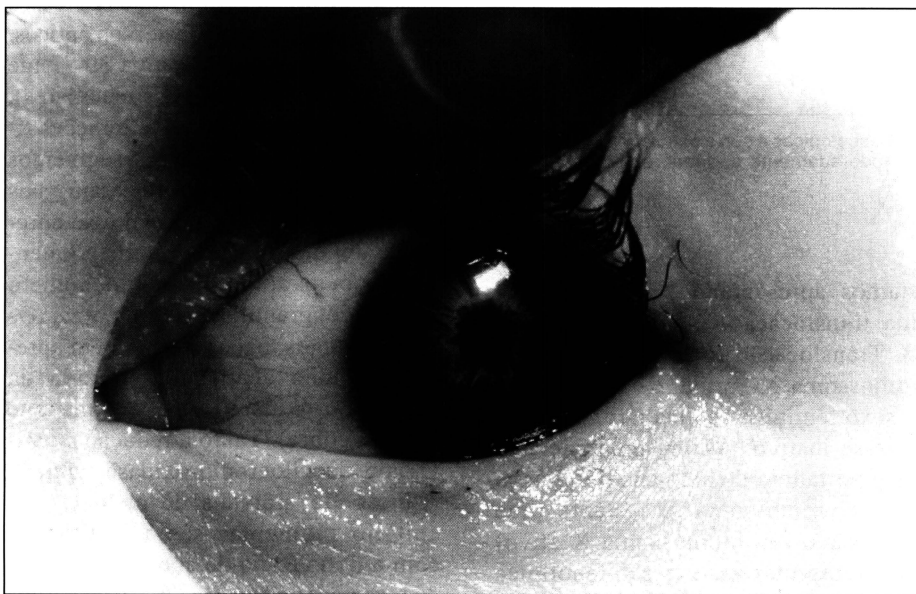
Fig. 1 - Hipoplasia do estroma anterior da íris.

Um bebê de 8 meses foi hospitalizado por apresentar convulsões e pneumonia de aspiração. Ele não fixava