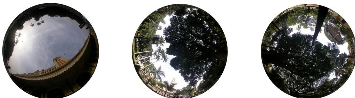
Figura 8 - Condições de exposição ao céu das bases no Bairro da Luz no inverno