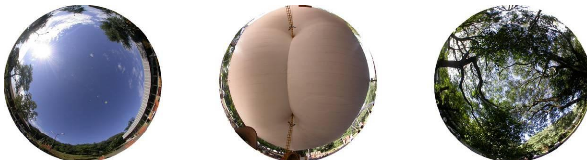
Figura 3 - Condições de exposição ao céu das bases na Cidade Universitária