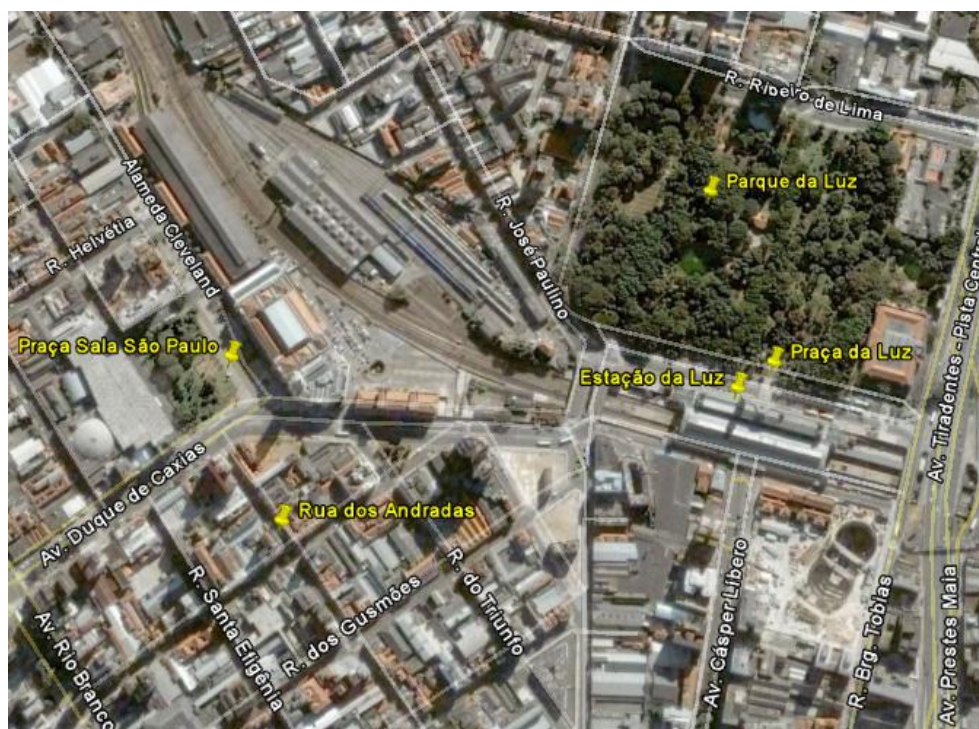
Figura 4 - Locais levantados empiricamente no Bairro da Luz

As Figuras 5 a 8 apresentam os ambientes físicos e as condições de exposição ao céu de cada uma das bases levantadas no verão (Rua dos Andradas, Praça Sala São Paulo e Parque da Luz) e no inverno (Estação da Luz, Praça da Luz e Parque da Luz).