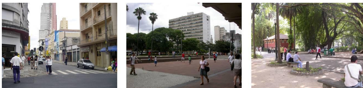
Figura 5 - Vista das bases levantadas empiricamente no Bairro da Luz no verão