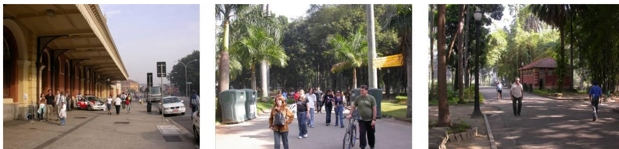
Figura 7 - Vista das bases levantadas empiricamente no Bairro da Luz no inverno