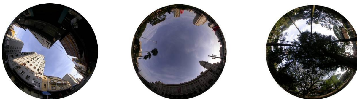
Figura 6 - Condições de exposição ao céu das bases no Bairro da Luz no verão