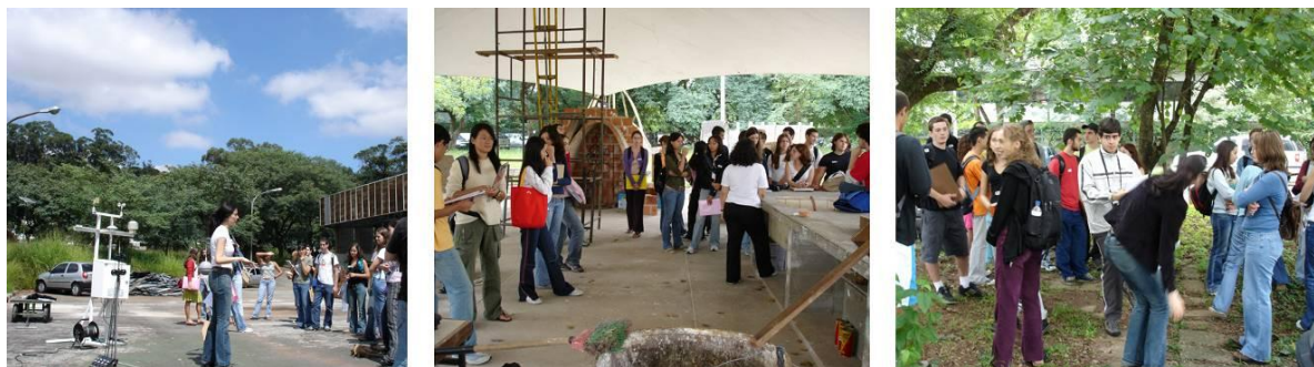
Figura 2 - Vista das bases levantadas empiricamente na Cidade Universitária