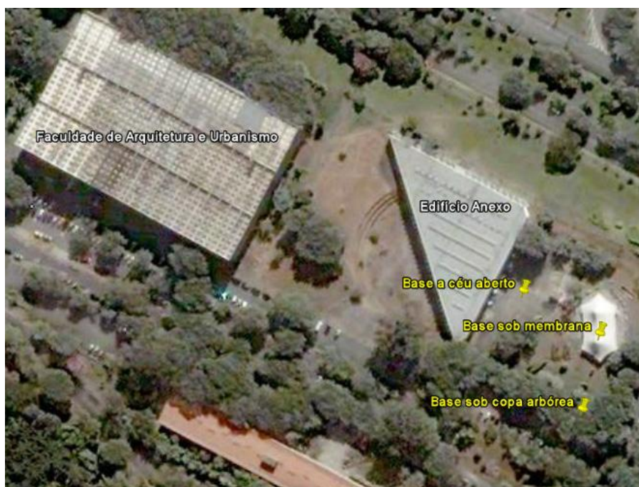
Figura 1 - Locais levantados empiricamente na Cidade Universitária

75 pessoas passou então pelos mesmos procedimentos, mas a troca de bases foi realizada em sentido inverso ao do primeiro grupo. As Figuras 1, 2 e 3 apresentam respectivamente localização, ambientes e condições de exposição ao céu das três bases monitoradas na Cidade Universitária.