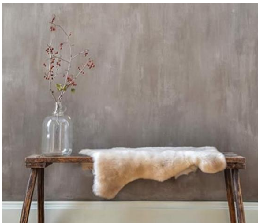
Figura 6 – Espacio pintado con pintura a la cal de la casa

Nota: *Masa de vapor de agua (g) que pasa por una superficie determinada (m 2 ) durante un periodo de tiempo determinado (24h=d); y **A0: ningún requisito.