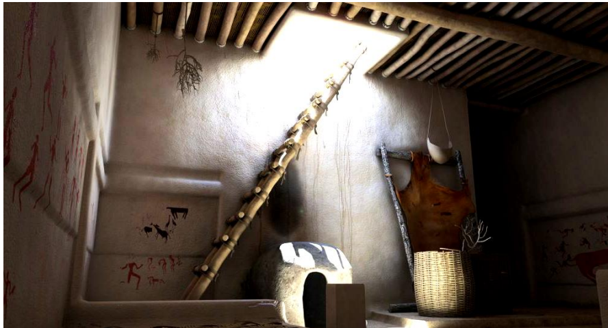
Figura 1 – Reconstrucción del interior de una vivienda de Çatalhöyük