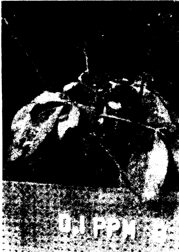
Figura 2. Sintoma de carência de boro (centro) e emissão de brotações com a aplicação de 0,1 ppm de boro no substrato.