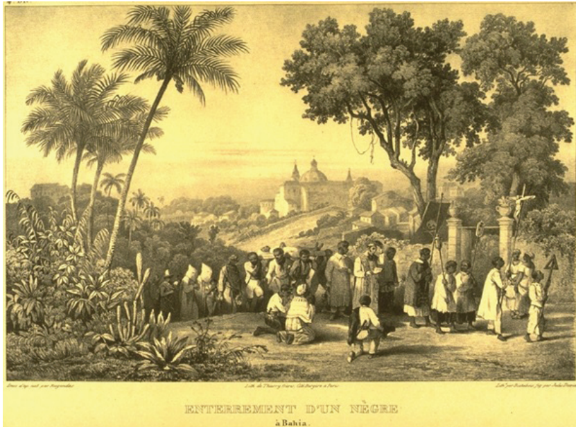
Figura 3 - Johann Moritz Rugendas. Enterro de um negro na Bahia, c. 1830.