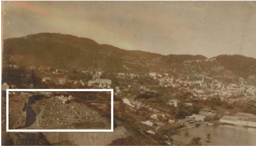
Figura 2 - Vista parcial de Florianópolis, 1920. Destaque em realce branco para o cemitério localizado na cabeceira da Ponte Hercílio Luz