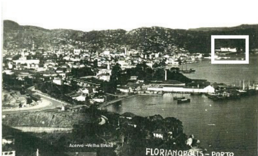
Figura 1 - Vista do centro da torre da ponte Hercílio Luz (1945). Destaque em realce branco para o Hospital de Caridade