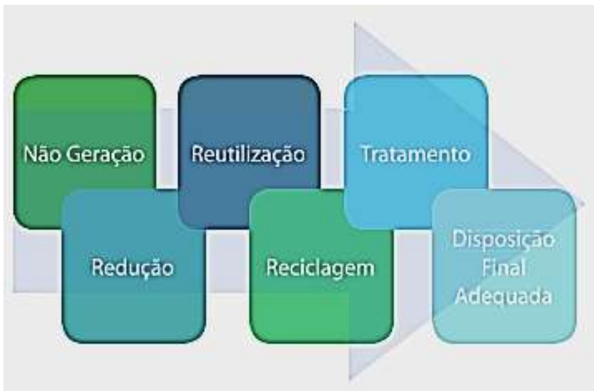
Figura 1. Ordem de prioridade no gerenciamento dos resíduos sólidos.