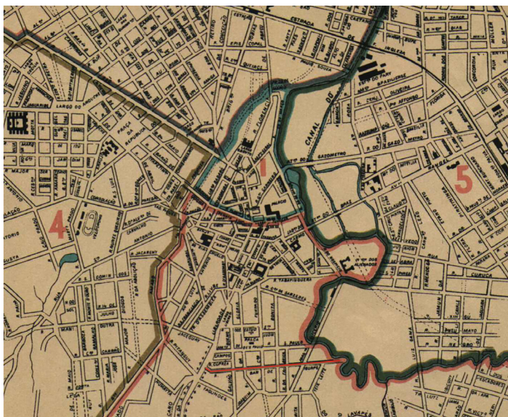
Figura 1 – Recorte da Planta Geral da Capital de São Paulo, 1897. A rua Barão de Iguape está destacada em vermelho, mostrando que acabava diretamente no rio antes da retificação. 6

A rua Barão de Iguape se localiza na Liberdade, um dos bairros centrais de São Paulo, na direção sul a partir da Sé, sendo uma das diversas ladeiras dessa região que ligavam o planalto em que se iniciou o núcleo urbano paulistano à várzea do rio Tamanduateí. 5 É uma das ruas que representam bem o terreno