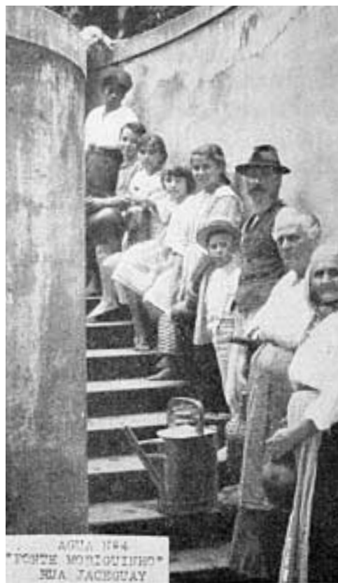
Figuras 8 e 9 – Abastecimento de água por bicas, em São Paulo, princípio do século XX.