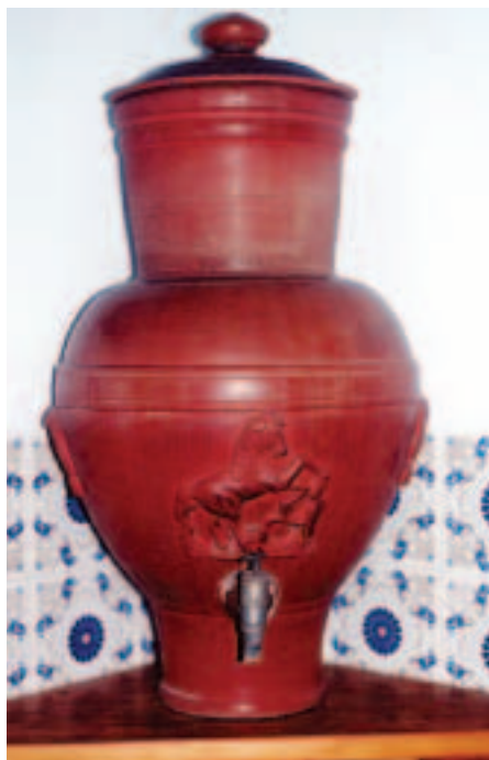
Figura 1 – Talha de cerâmica com torneira de chumbo fabricada no início do século XX, por empresa desconhecida. Acervo pessoal de Márcio Augelli, São Paulo-SP, 2003.

Em São Paulo, a partir dos últimos anos do século XIX e princípio do século XX, começaram a surgir, em livros, almanaques e jornais, várias referências a aparelhos e equipamentos de filtragem e purificação de água para consumo doméstico. Algumas publicações e propagandas ressaltavam os filtros Berkefeld e Chamberland, como os mais indicados para a higienização domiciliar de água.