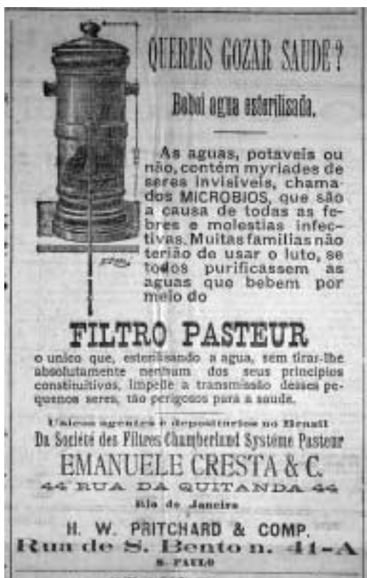
Figura 2 – Propaganda do Filtro Pasteur, publicada num jornal (não identificado) de São Paulo, provavelmente da década de 1910 ou 1920. A referência aos representantes comerciais mostra que se tratava de um produto importado.