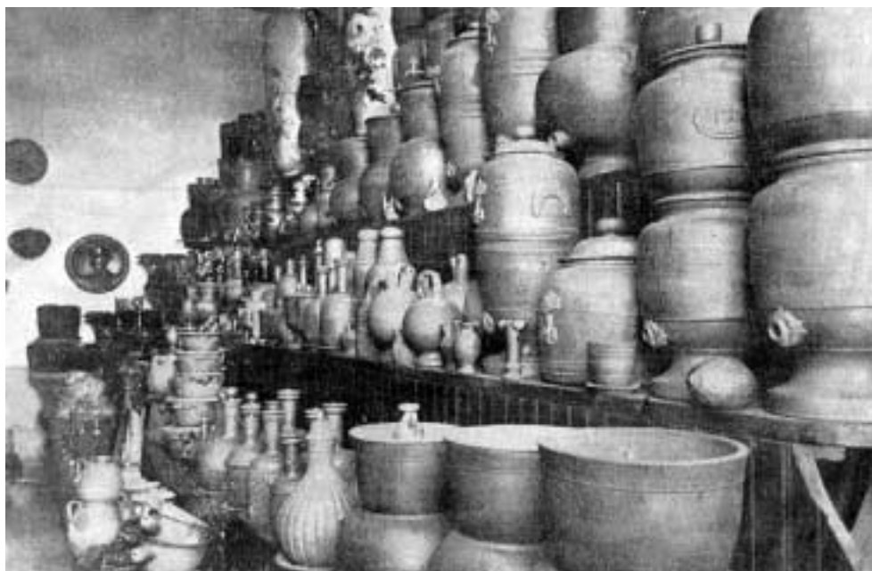
Figura 6 – Filtros em estoque na Cerâmica Paulista: no canto superior direito, vários filtros, sem a torneira; mais abaixo, algumas talhas. (LAPRI, [1922?]).

Já no começo da década de 1920, de acordo com um texto publicitário em Lapri ([1922?]), a empresa fabricava "todos os artigos de ceramica propriamente ditas e especialmente filtros, talhas e moringues para agua: jarros e cachepots de terra-cotta para pintura, vasos para jardins, etc. etc." (Figura 6).