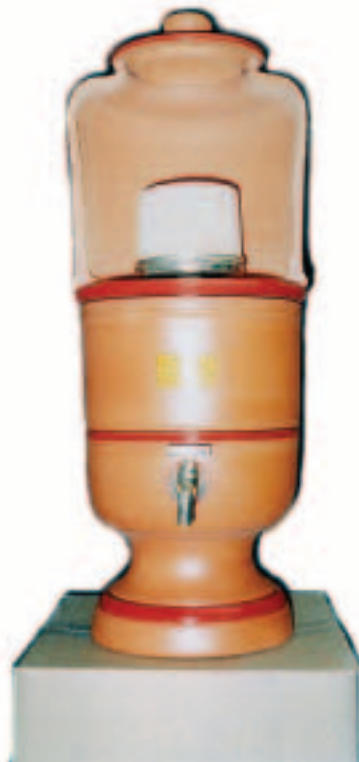
Figuras 10 e 11 – À esquerda, uma réplica do primeiro Filtro São João; à direita, uma réplica dos anos 1940, com o reservatório superior seccionado para a visualização da vela filtrante. A vela filtrante e as torneiras são originais da época. Acervo da Cerâmica Stéfani, Jaboticabal-SP, 2003.