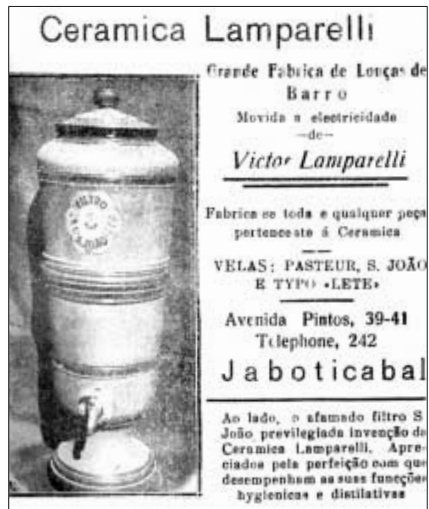
Figura 12 – Propaganda da Cerâmica Lamparelli. Diário de Jaboticabal , 5/11/1938.