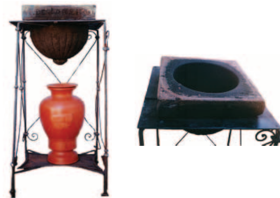
Figuras 4 e 5 – Filtro de pedra original, sob dois ângulos diferentes. A talha situada abaixo do filtro é uma réplica, fabricada pela Cerâmica Stéfani (Jaboticabal-SP). Acervo da Paróquia de Nossa Senhora de Lourdes, Jaboticabal-SP, 2003.

Esses equipamentos filtrantes, tais como o Filtro Pasteur e o filtro de pedra, não tinham o uso generalizado, e suas importações deveriam ser pouco significativas. Na descrição dos produtos importados pelo Brasil, por meio do Porto de Santos, na década de 1920, não existe menção a esses objetos 7 . No entanto, o aumento das suas referências demonstra que havia uma crescente preocupação com a qualidade da água que era bebida. Os livros e publicações tratando da “filtração doméstica” e as propagandas de equipamentos filtrantes significam a existência de um incipiente mercado relacionado à purificação de água para beber em São Paulo.