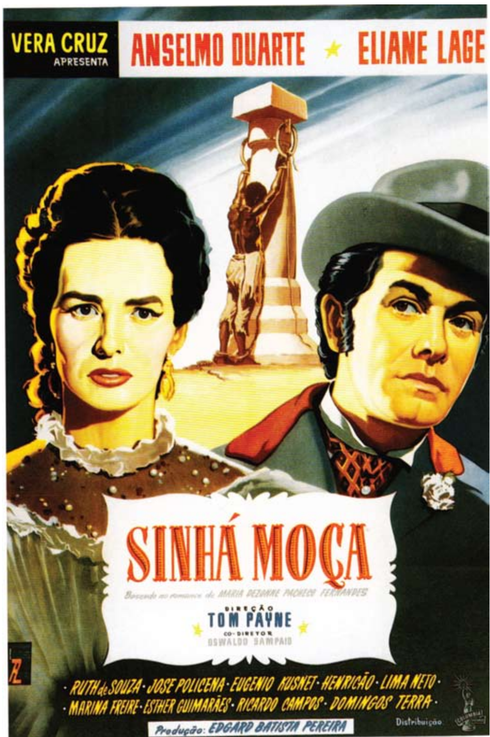
Figura 15 – Cartaz de Sinhá Moça . 1953.