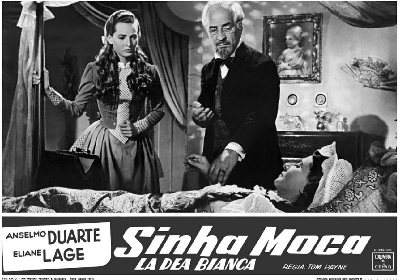
Figura 16 – Fotografia não identificada. Cartaz italiano de Sinhá Moça . Itália, 1954.