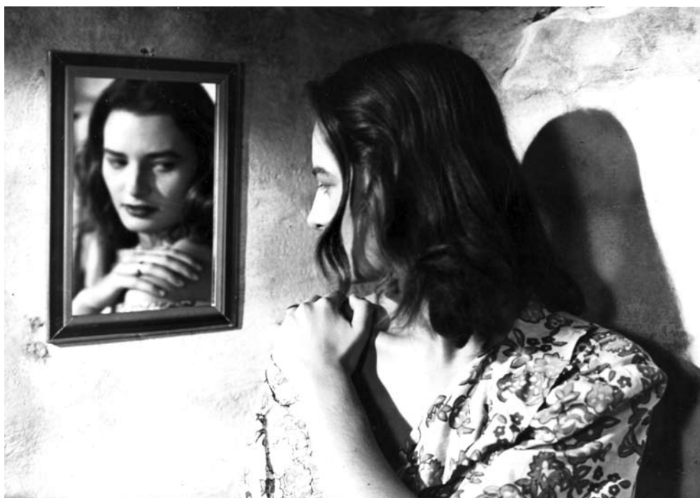
Cia. Cinematografica VERA CRUZ apresenta "CAIÇARA" Produção de CAVALCANTI - Direção de ADOLFO CELI - Distribuição da UNIVERSAL INTERNACIONAL