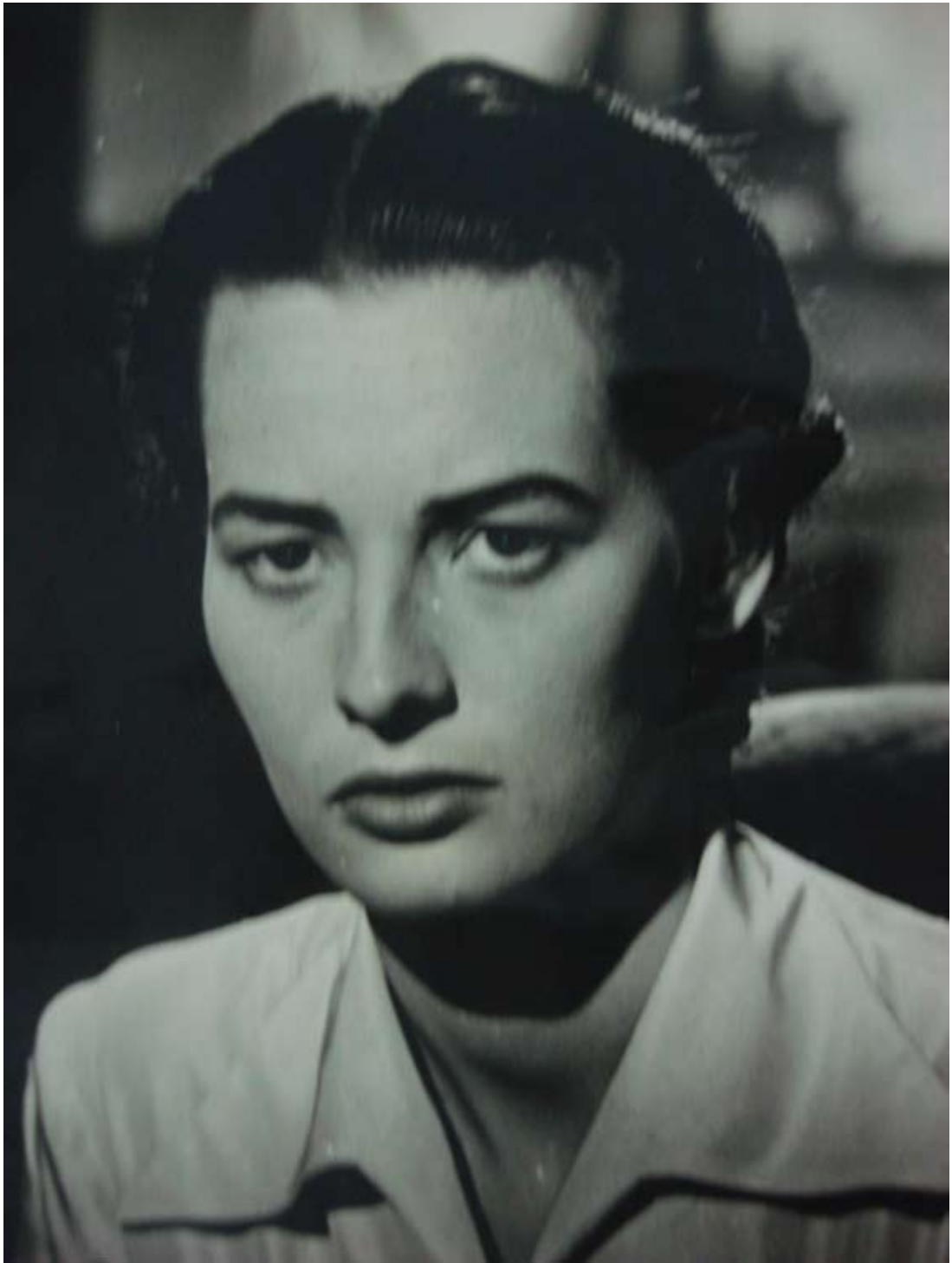
Figura 9 – Fotografia não identificado. Eliane Lage. Sem data. Acervo do Serviço de Patrimônio Histórico, Prefeitura de São Bernardo do Campo.