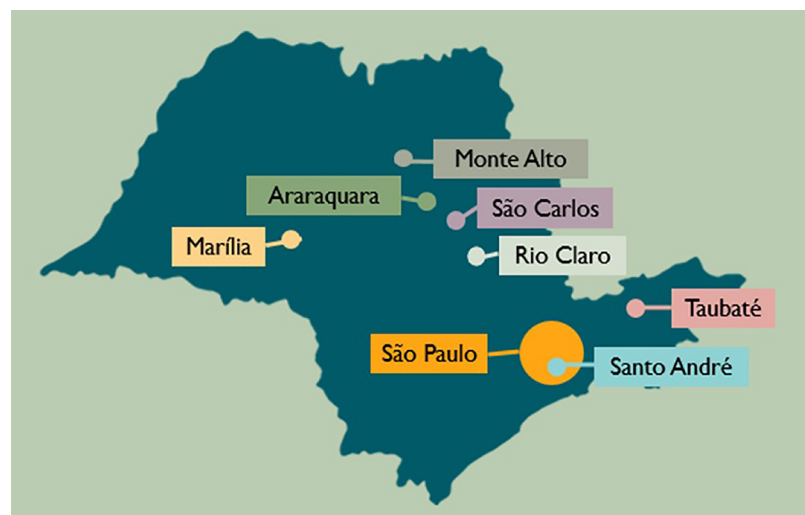
Figura 1 – Distribuição das instituições analisadas no estado de São Paulo.

A partir da análise comparativa das exposições paleontológicas das instituições paulistas estudadas, é possível observar alguns padrões.