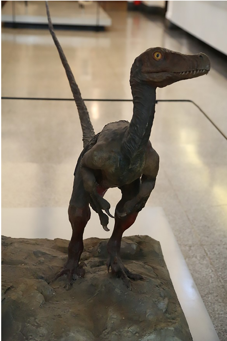
Figura 2 – Exemplo de paleontografia (restauração), 49 utilizada pelo Museu de Zoologia da USP, 2019.

De certa forma, a paleontografia assume o papel narrativo dos dioramas ao representar visões de ambientes pretéritos, ocupando majoritariamente o primeiro nível discursivo.