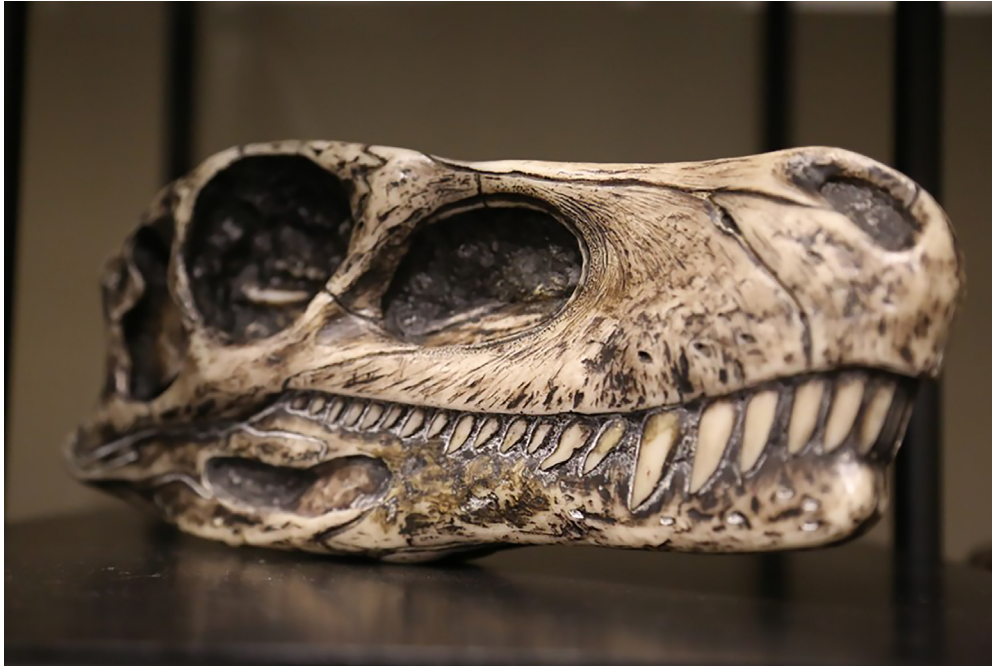
Figura 3 – Exemplo de ilustração paleontológica (réplica), 54 presente na exposição do Museu de Zoologia da USP, 2019.

A separação em níveis narrativos permitiu evidenciar uma diferença na escolha do tipo de iconografia aplicada em cada um dos níveis avaliados.