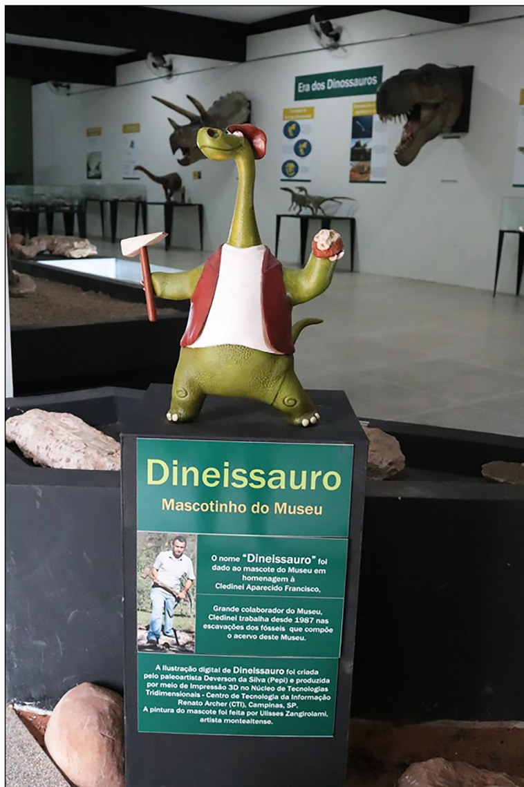
Figura 5 – Exemplo de paleoimageria 57 (lúdica), presente no Museu de Paleontologia “Professor Antonio Celso de Arruda Campos”, 2019.

Foi registrada apenas uma ocorrência de paleoimageria em primeiro nível narrativo (Figura 5), no MPMA, onde o mascote do museu, o Dineissauro, é exibido em um modelo tridimensional dentro de uma vitrine. Em todos os outros casos a paleoimageria foi utilizada apenas como suporte narrativo, sendo categorizado como iconografia de segundo nível.