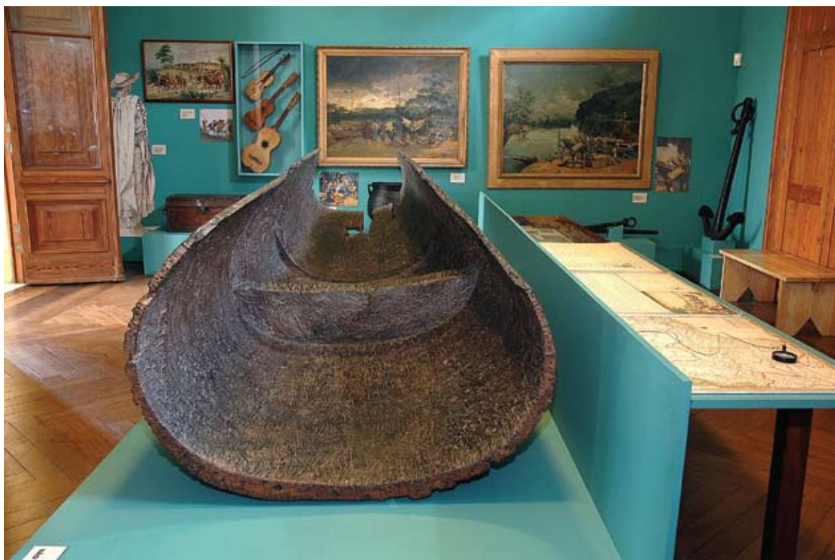
Figura 1 – Sala Vivência e cotidiano no Sertão, exposição Cartografia de uma história: São Paulo colonial, mapas e relatos . Museu Paulista, São Paulo. Fotografia de José Rosael, 2005.

A segunda trilha 10 foi pensada como uma ambientação sonora para a sala Vivência e cotidiano no Sertão. Nela, foram expostos quadros e objetos que abordam o cotidiano bandeirista, com especial destaque para A partida da Monção , de Almeida Júnior. No centro da sala, um fragmento de enorme canoa cavada em única tora de madeira faz menção ao Tietê e, a seu lado, o original do Diário de Navegação (Figura 1). Esse documento é apresentado com seus respectivos mapas, de autoria do sargento-mor Teotônio José Juzarte que, a 13 de abril em 1769, largava de Porto Feliz com trinta e seis embarcações e 800 pessoas em monção que desceu o Tietê, o Paraná e o Iguatemi até a praça do mesmo nome.