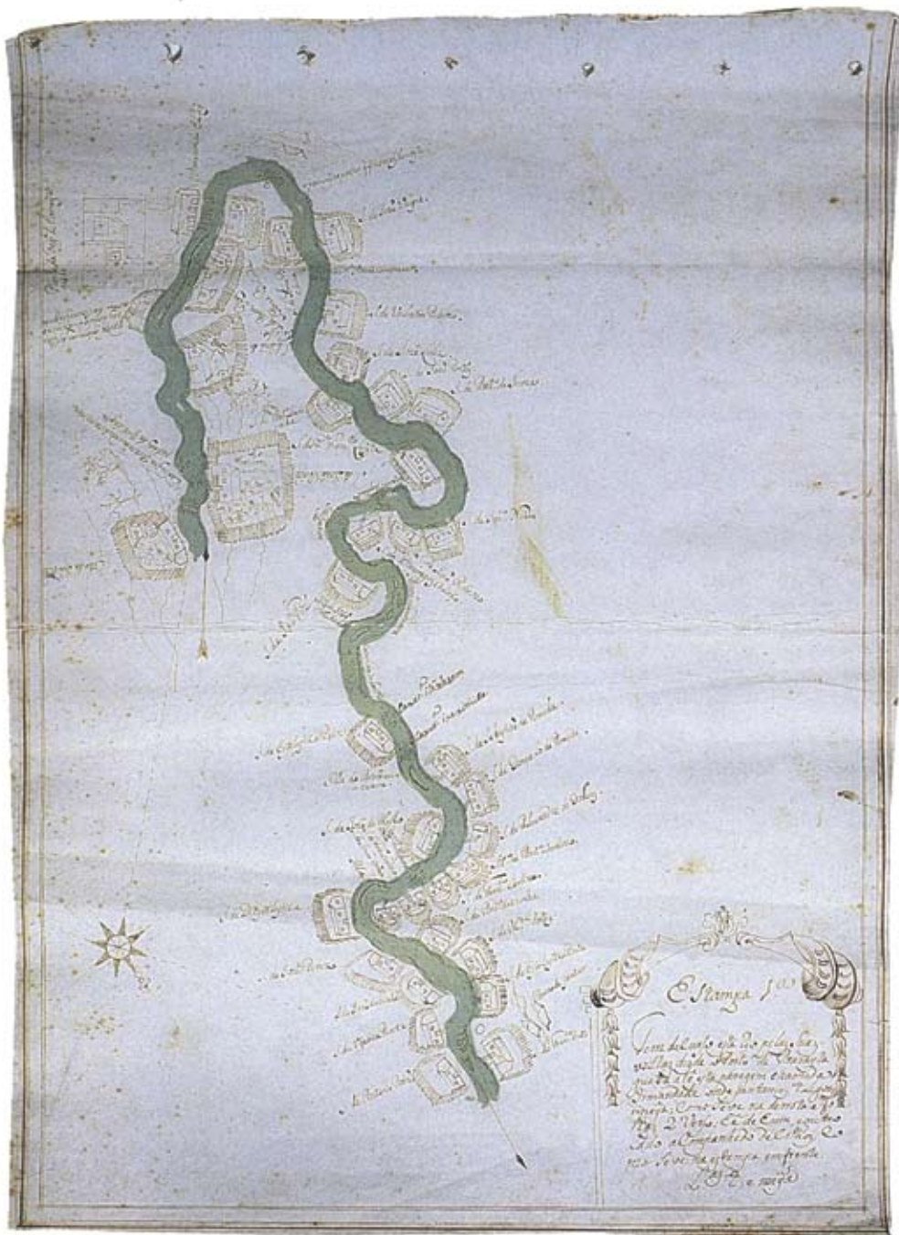
Figura 4 – Teotônio José Juzarte. Folha do mapa de navegação, representando o trecho inicial a partir do porto de Araritaguaba (atual Porto Feliz) até a paragem de Irmandade, figurando e identificado cachoeiras e sítios, 1769. Diário da Navegação , 2000, p.370.