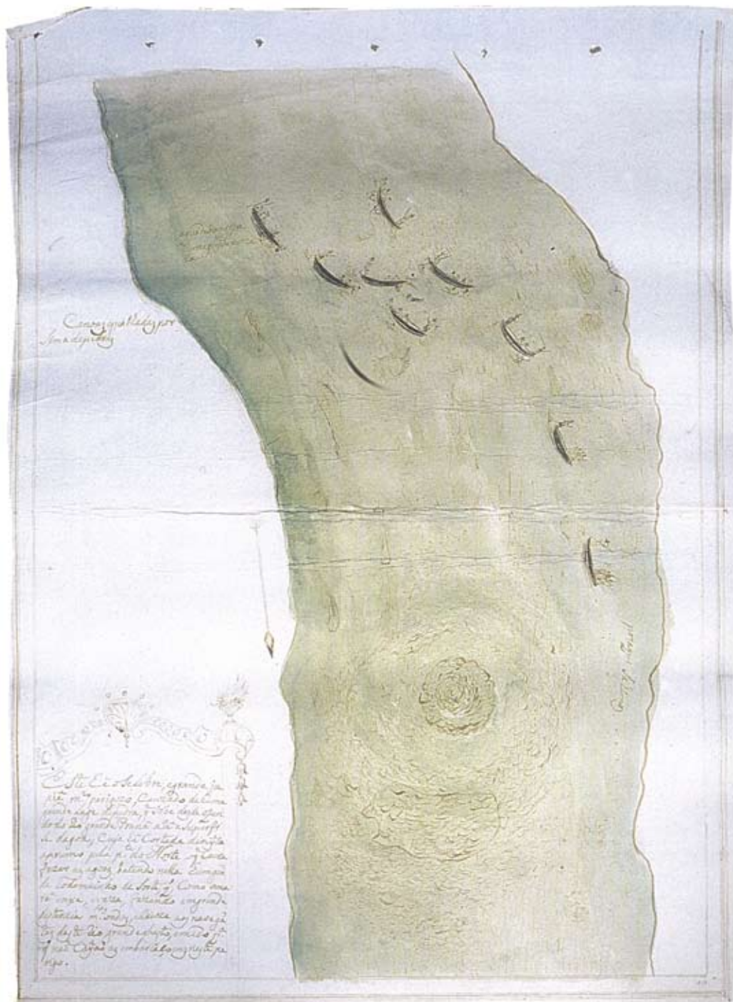
Figura 7 – Teotônio José Juzarte. Este é o célebre e grande Jupiau, muito perigoso, causado de uma grande lage de pedra, que sobe desde o fundo do rio Grande Paraná até a superfície da água (...) o que causa fazer as águas batendo nela um grande rodamoinho..., 1769. Diário da Navegação, 2000, p. 397.