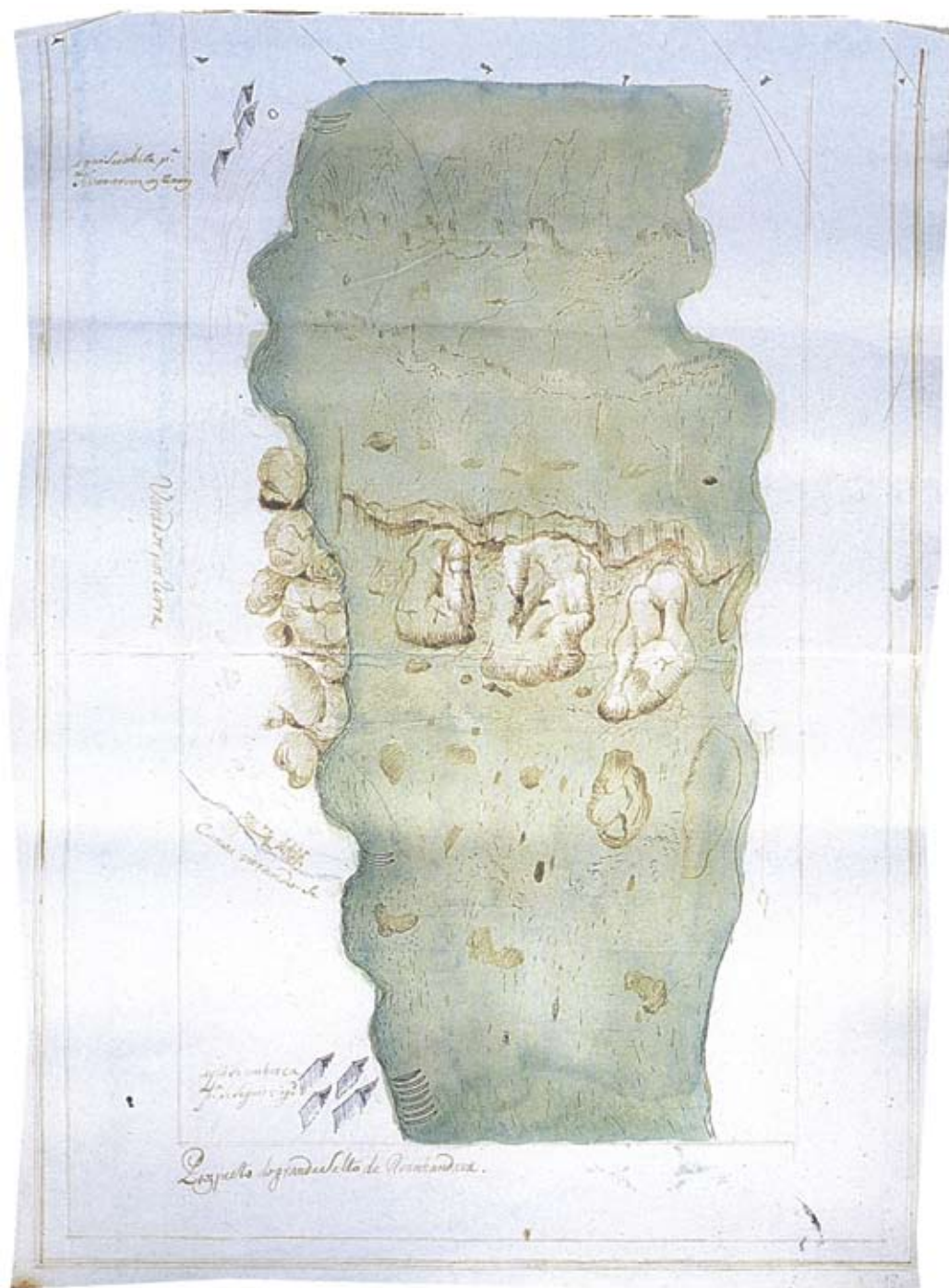
Figura 5 – Teotônio José Juzarte. Prospecto do grande Salto de Avanhadava , situado no rio Tietê, 1769. Diário de Navegação , 2000, p. 385.