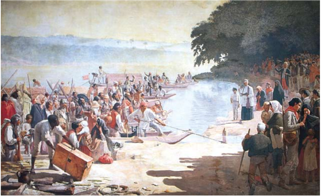
Figura 2 – A partida da Monção de José Ferraz de Almeida Júnior (1850-1899). Óleo sobre tela, 640 x 390cm. Acervo do Museu Paulista da USP.

Pai Nosso Pequenino Deus me leve em bom caminho Sete anjos me acompanha Sete velas me alumeia São Francisco é meu padrinho Santa Maria é minha madrinha Que me fez a cruz na testa Nada de mau me persiga Nem de noite nem de dia Nem no ponto do meio dia Nem na hora d'eu deitar Para sempre, Virgem Maria 17 .