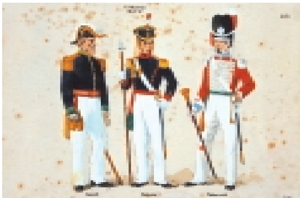
FIGURA 4 – Uniforme do Barão de Sabará (1840). Desenho de Wash Rodrigues. Uniformes de sargento e tambor-mor. Figurinos do tenente José Maria Araújo (1841). Acervo Museu Paulista da USP. Reprodução de Hélio Nobre.

Todas essas alterações mostram como sempre nos deparamos no estudo dos uniformes da Guarda Nacional com a busca de diferenciações entre os postos por parte dos milicianos ou o seu aperfeiçoamento pelos comandantes e governo. O interesse residia principalmente na sinalização dos postos de comando, e temos a este respeito um exemplo bem claro no uniforme de guarda nacional do barão de Sabará (FIGURA 4).