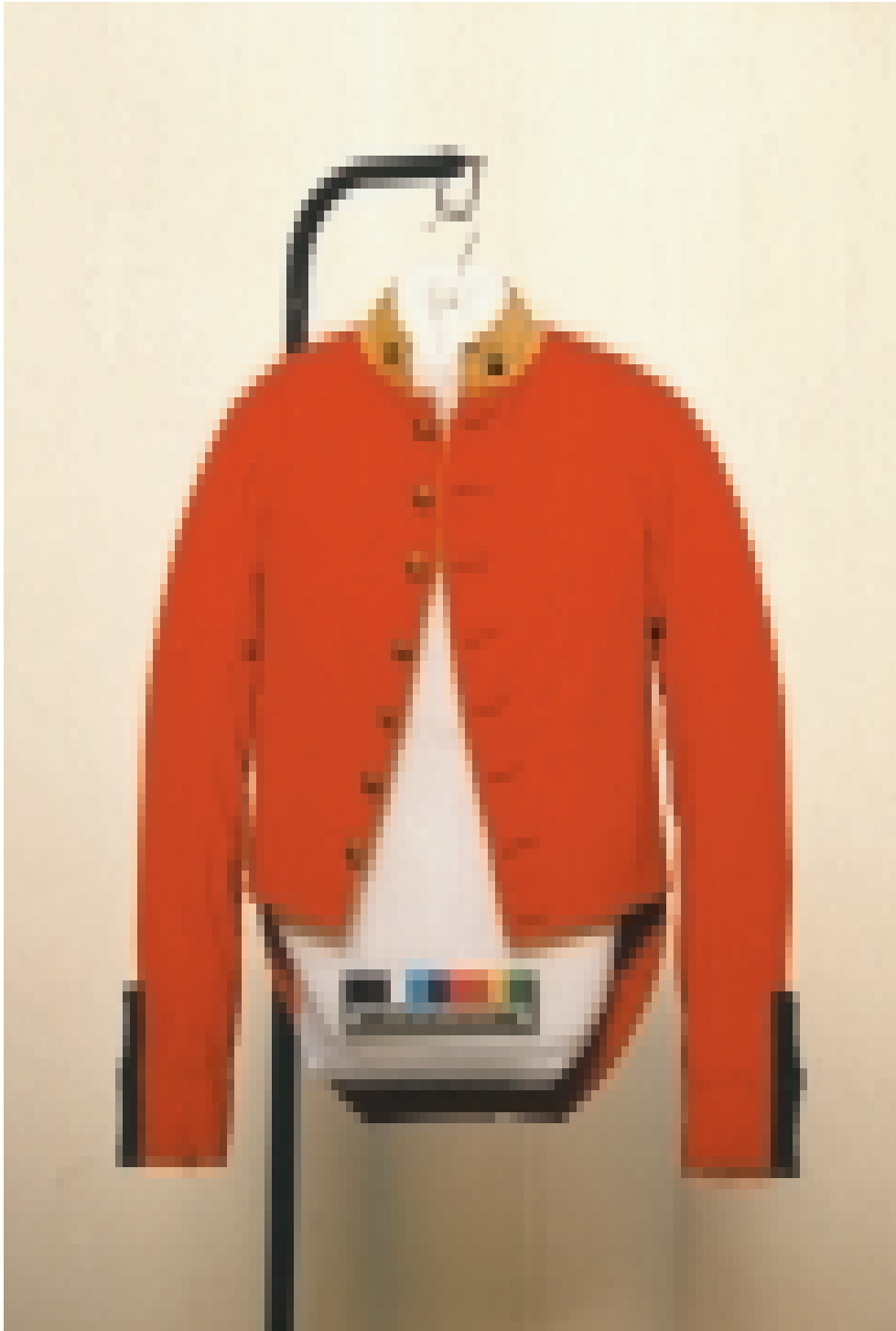
FIGURA 3 – Casaca de guarda de cavalaria. Peça de indumentária, 2º plano de uniformes (1852). Acervo Museu Paulista da USP.