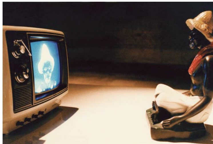
Figura 2. Nam June Paik, TV Buddha (versão para a 11ª edição do Videobrasil), 1996. Videoinstalação.

interior, abordando não apenas as questões técnicas, mas também conceituais. Nam June Paik, assim como muitos outros artistas do vídeo, não escondia as mediações técnicas que sustentavam suas obras.