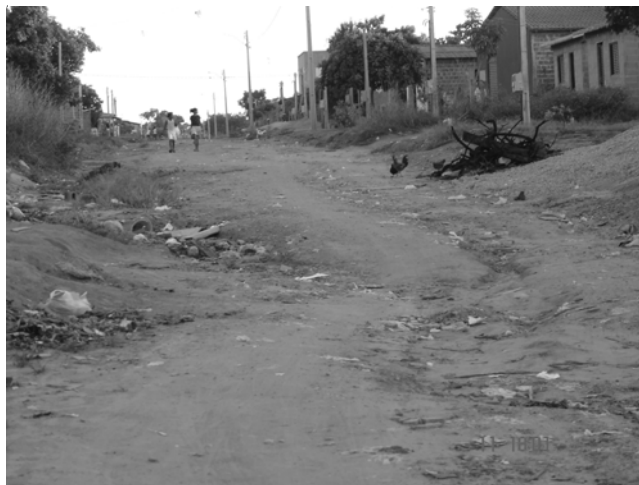
Figura 2 – Via sem Pavimentação Asfáltica no Setor Santa Fé (Palmas Sul)