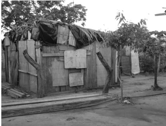
Figura 1 - Habitação Precária no Setor Santa Bárbara (Palmas Sul)