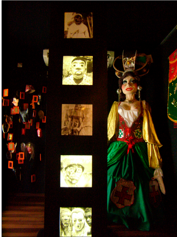
Figura 2. Mamãe exposta na sala Festejar Alagoano do Museu Théo Brandão.