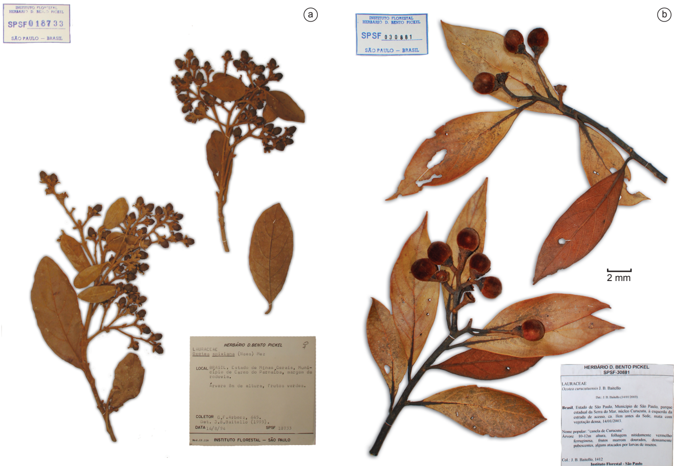
Figura 1. Exsicatas de a) Ocotea spixiana ; e b) Ocotea curucutuensis : nota-se a marcante diferença no tamanho dos frutos adultos.

Para a análise sobre a distribuição e o habitat das espécies, foram levantados os registros de Ocotea curucutuensis e Ocotea spixiana , na base de dados do Species-link do Centro de Referências em Informação Ambiental (CRIA). Com base na lista dos registros para as duas espécies, foram examinadas as exsicatas depositadas em três herbários representativos da Região Sudeste: Instituto Florestal (SPSF), Instituto de Pesquisas Jardim Botânico do Rio de Janeiro (RB) e Universidade Estadual de Campinas (UEC).