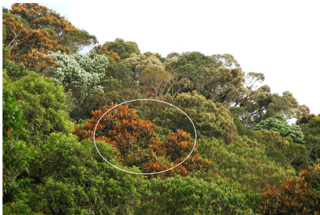
Figura 6. Aspecto da Floresta Ombrófila Densa Alto-Montana, na região do Pico do Itapeva, em Campos de Jordão, com destaque para as copas ferrugíneas de Ocotea curucutuensis . (Foto: J.B.Baitello).

Figure 5. View of the High Montane Rain Forest near the Pico do Itapeva between Campos do Jordão and Pindamonhangaba, São Paulo. The ferruginous-coloured tree-canopies are all Ocotea curucutuensis and show the high frequency of this species in the area. (Photograph: J.B. Baitello).