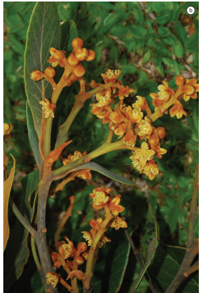
Figura 2. Detalhe das inflorescências de um indivíduo a) feminino e b) masculino de Ocotea curucutuensis , na região do Pico do Itapeva, Campos do Jordão, SP..

Figure 2. Detail of the inflorescences of a) female and b) male individuals of Ocotea curucutuensis near the Pico de Itapeva, Campos do Jordão, São Paulo.