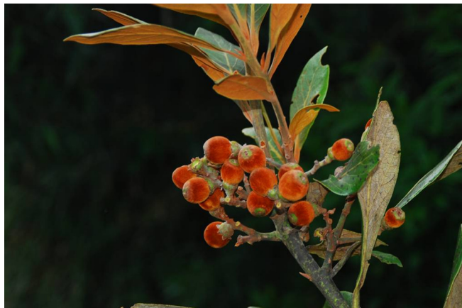
Figura 3. Detalhe de infrutescência de Ocotea curucutuensis , na região do Pico do Itapeva, Campos do Jordão, SP. (Foto: J.B. Baitello).

Figure 3. Detail of fruits of Ocotea curucutuensis near the Pico do Itapeva, Campos do Jordão, São Paulo. (Photograph: J.B. Baitello).