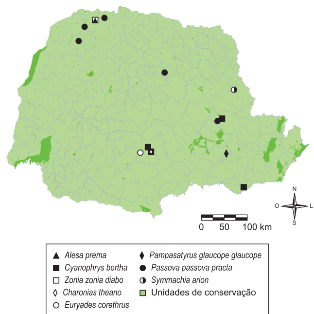
Figura 1. Novos registros de distribuição de borboletas ameaçadas de extinção para o Paraná.

Distribuição geral: BRASIL: Rio Grande do Sul: Derrubadas (Parque Estadual do Turvo) (DZUP); São Paulo: Campinas (DZUP) e Pereira Barreto (DZUP); Goiás: Leopoldo Bulhões (BMNH); Mato Grosso: Barra do Garças (DZUP) e São Vicente