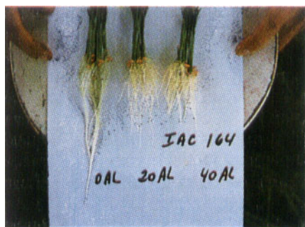
FIGURA 2. Sistema radicular do cultivar IAC-164 após dez dias de crescimento em soluções nutritivas contendo 0, 20 e 40mg/litro de alumínio, empregando-se a temperatura de 30 \pm 1^\circ\text{C} .