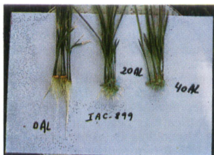
FIGURA 3. Sistema radicular do cultivar IAC-899 após dez dias de crescimento em soluções nutritivas contendo 0, 20 e 40mg/litro de alumínio, empregando-se a temperatura de 30 \pm 1^\circ\text{C} .

QUADRO 2. Análise da variância para crescimento da raiz de onze cultivares de arroz testados durante dez dias em soluções contendo seis diferentes concentrações de alumínio, empregando-se a temperatura de 30 \pm 1^\circ\text{C}