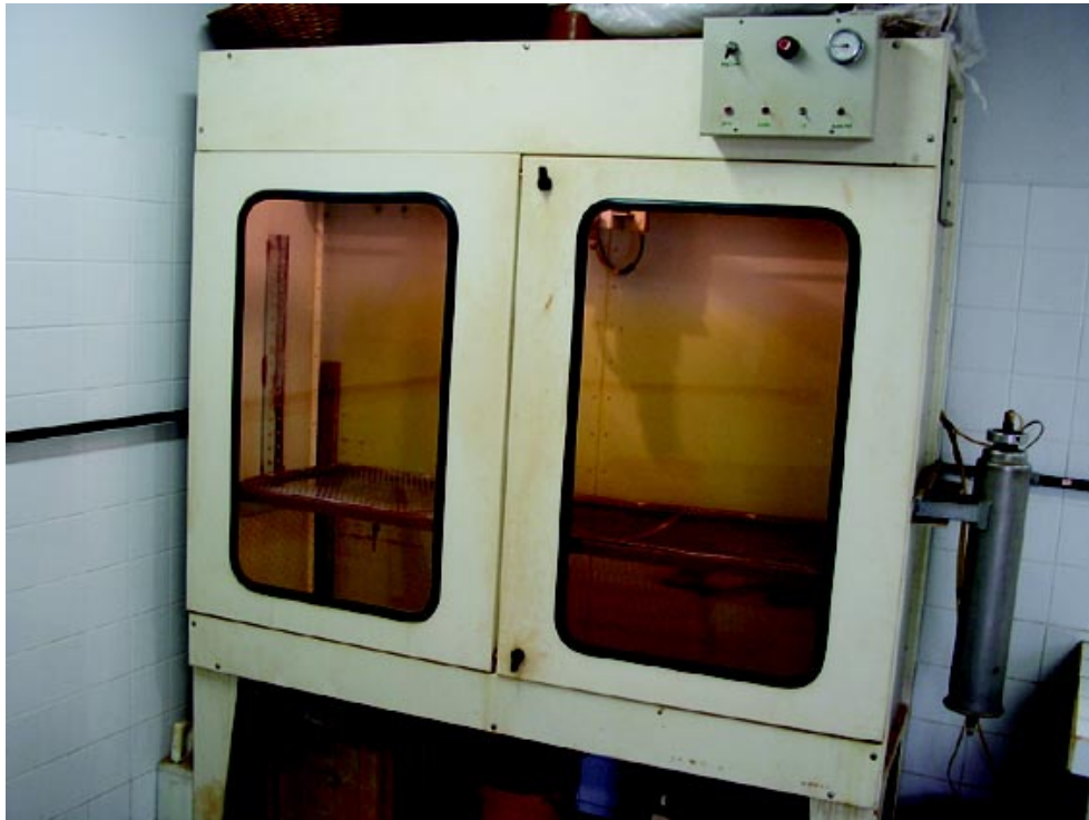
Figura 1. Câmara de aspersão onde foram feitas as aplicações de glyphosate.

Os resultados foram submetidos à análise da variância do programa estatístico SAS (Statistical Analysis System), com o objetivo de verificar se as doses do herbicida glyphosate acusaram efeito significativo na resposta das plantas daninhas. Para isso, foram utilizados somente os dados da variável biomassa verde, pois a biomassa seca apresentou grande variabilidade, não apresentando bom ajuste da curva dose-resposta. A determinação da curva dose-resposta obtida pelo modelo matemático log-logístico, proposto por SEEFELDT (1995), é a seguinte: