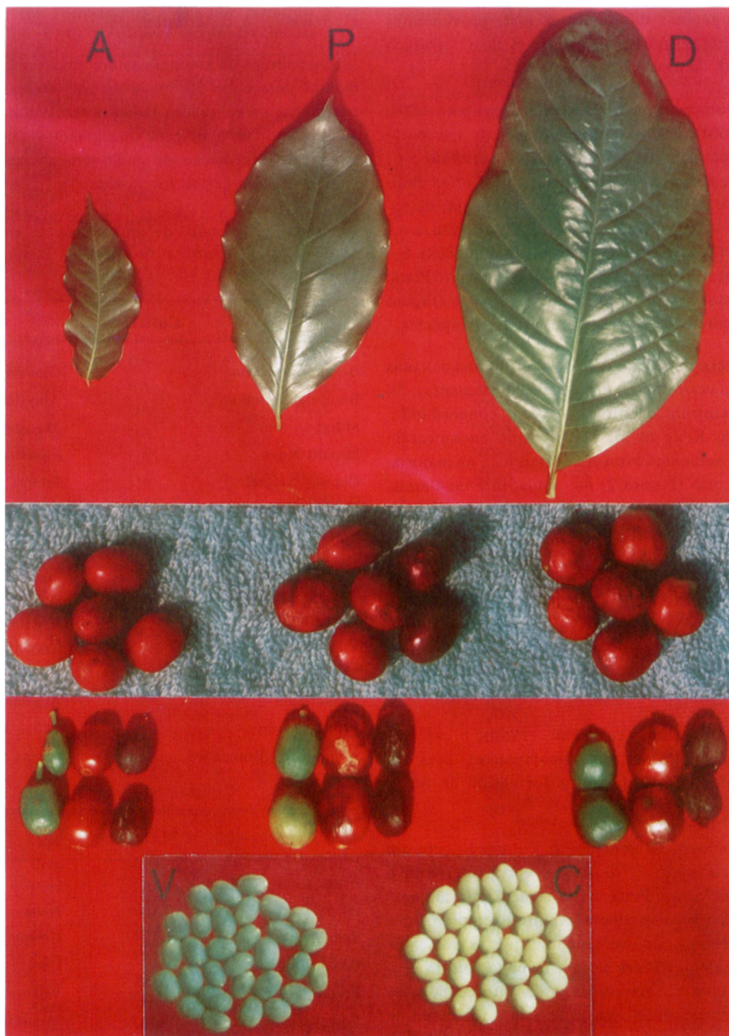
Figura 2. Folhas e frutos de C. arabica (A), C. dewevrei (D) e do café Piatã (P). Endospermas verde (V) de A e cera (C) de D, que segregam no Piatã.