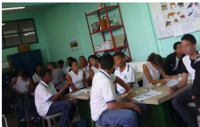
Figura 3. Estudantes do 6º ano no laboratório de Ciências da Escola Estadual de Ensino Fundamental Visconde de Mauá.

Os kits e a cartilha foram avaliados em atividades práticas realizadas no laboratório de Ciências, com estudantes do Ensino Fundamental do 6º ano da Escola Estadual de Ensino Fundamental Visconde de Mauá, da rede FAETEC, situado na Zona Norte da cidade do Rio de Janeiro (Figuras 3 e 4). Foi escolhido o 6º ano por estarem previstas, no PCN, neste ano, as disciplinas de Ciências e de Geografia, que abordam, ao mesmo tempo, temas como a origem dos seres vivos, solo, tempo geológico e deriva continental.