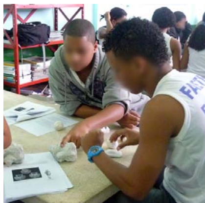
Figura 4. Os estudantes comparando a cartilha com os moldes na réplica de rocha.

A aula prática durou, em média, os dois tempos de aula (90 min.). A turma foi dividida em grupos de três a quatro alunos, cada grupo com um kit. Foi perguntado, inicialmente, se eles tinham ideia do material que estava sobre a mesa. Muitas especulações surgiram, algumas até próximas do que as réplicas realmente seriam. Em seguida, foi perguntado, aos alunos, o que são fósseis. A maioria respondeu que eram animais que não viviam mais. Após a introdução da cartilha, esse conceito foi esclarecido. Na introdução da cartilha e nos outros textos não ligados diretamente à resposta dos desafios, os alunos que se prontificaram foram convidados a ler em voz alta. Desta forma, evitou-se que os alunos se dispersassem por algum motivo externo, e os incentivou a colaborar com a dinâmica da aula. Para cada desafio, foram disponibilizados vinte a trinta minutos para a conclusão, e, após esse período, foi perguntado qual era a resposta e a justificativa.